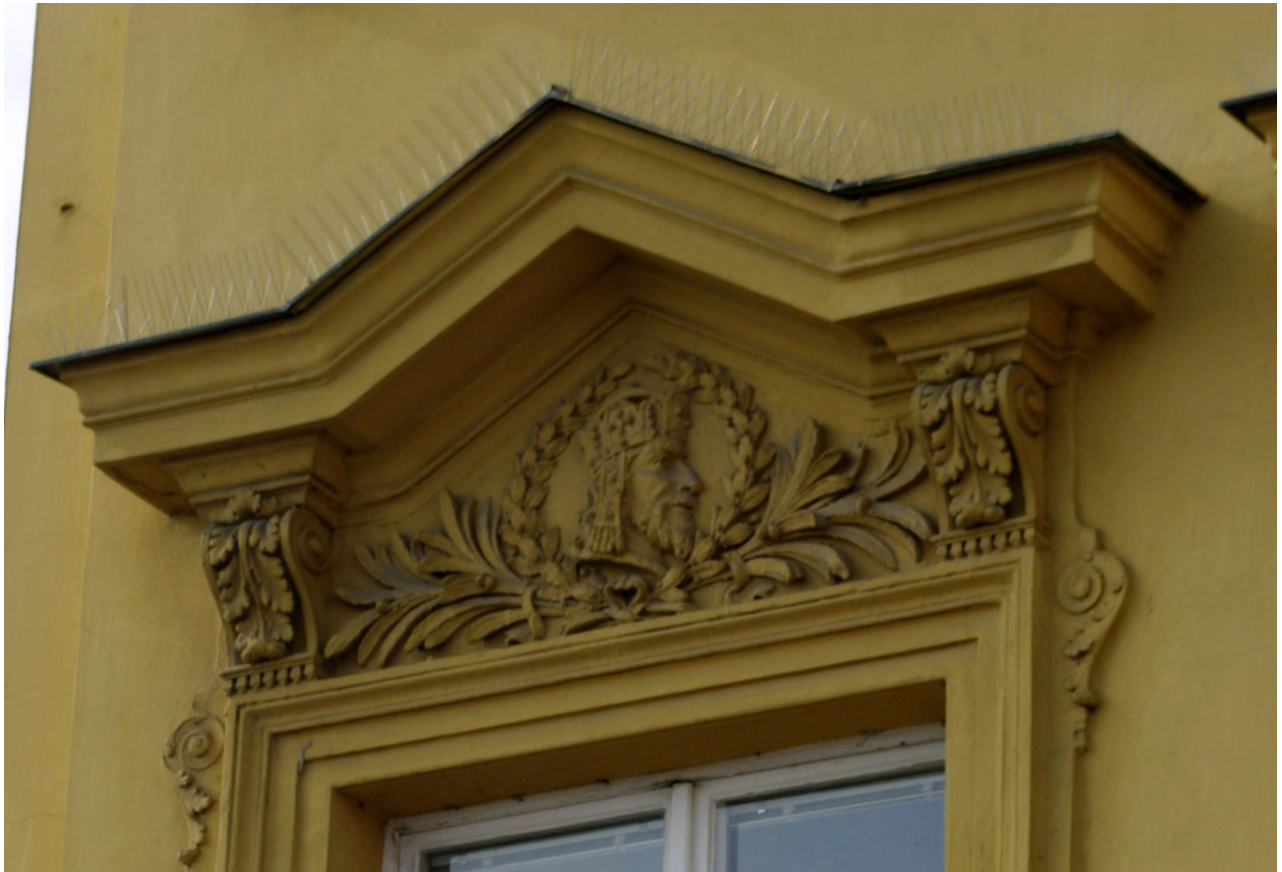
Obr. 26: Fronton prvního okna východního průčelí v úrovni 2.N.P. (počítáno od jihu); v suprafenstře se nachází basreliéf Karla IV. (Kudrnovský, 2013).