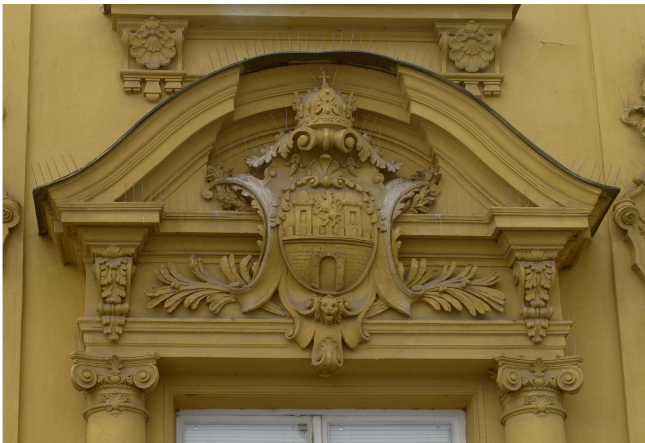
Obr. 28: Fronton třetího okna východního průčelí v úrovni 2.N.P. (počítáno od jihu); v suprafenestře se ve zdobné kartuši nachází znak města Dvora Králové s královskou korunou (Kudrnovský, 2013).