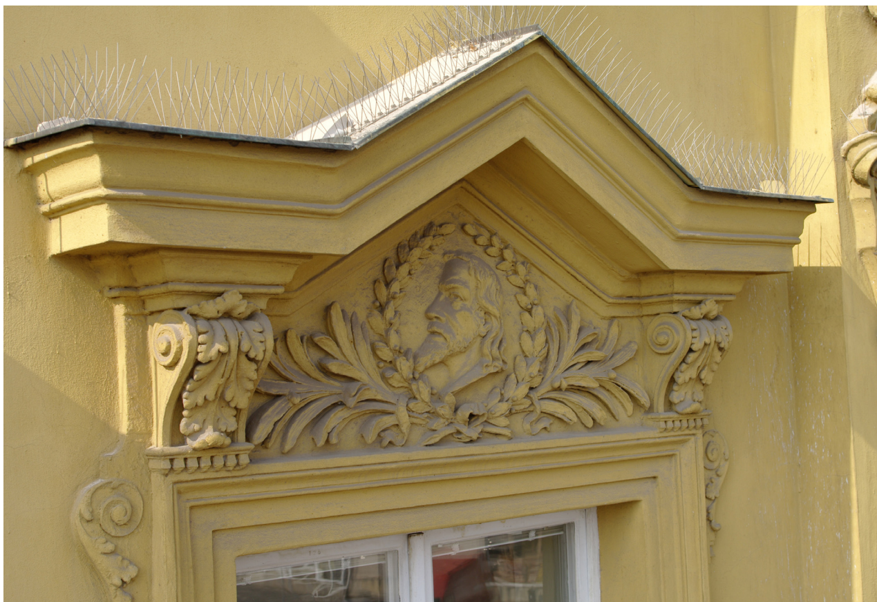
Obr. 34: Fronton devátého okna východního průčelí v úrovni 2.N.P. (počítáno od jihu); v suprafenstře se nachází basreliéf mistra Jana Husa (Kudrnovský, 2013).