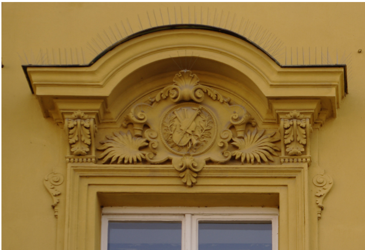
Obr. 59: Fronton šestého okna severního průčelí v úrovni 2.N.P. (počítáno od východu); v suprafenstře se nachází basrelief hudebních nástrojů, jakožto symbolů hudby (Kudrnovský, 2013).