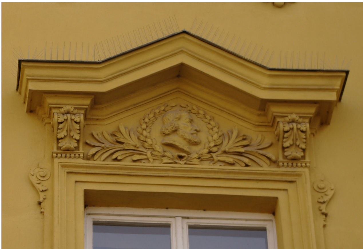
Obr. 56: Fronton třetího okna severního průčelí v úrovni 2.N.P. (počítáno od východu); v suprafenestře se nachází basrelief snad Sofokla či Svatopluka Čecha (Kudrnovský, 2013).