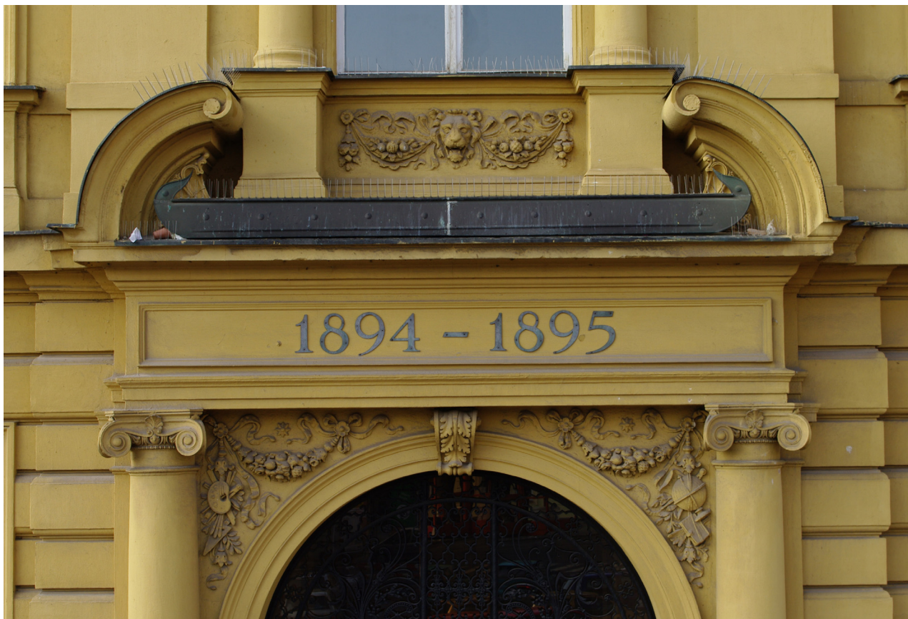
Obr. 44: Horní část vstupní edikuly, v prostoru kladí je umístěno plasticky zvýrazněné pole s letopočtem výstavby budovy gymnázia (Kudrnovský, 2013).