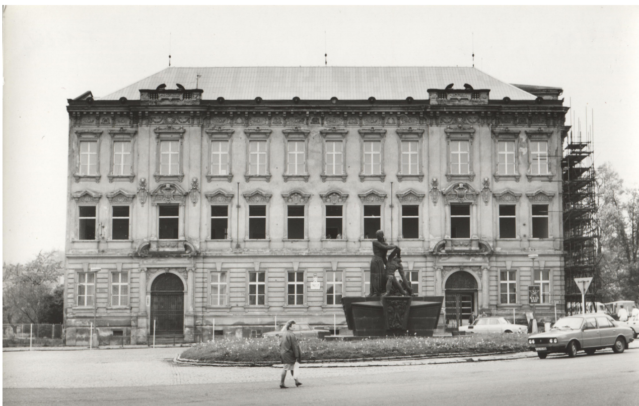
Obr. 20: Oprava fasády severního průčelí, konec 80. let (archiv Městského muzea v DKnL, Gymnázium, F3/91, F1626/4 Městské muzeum DKnL).