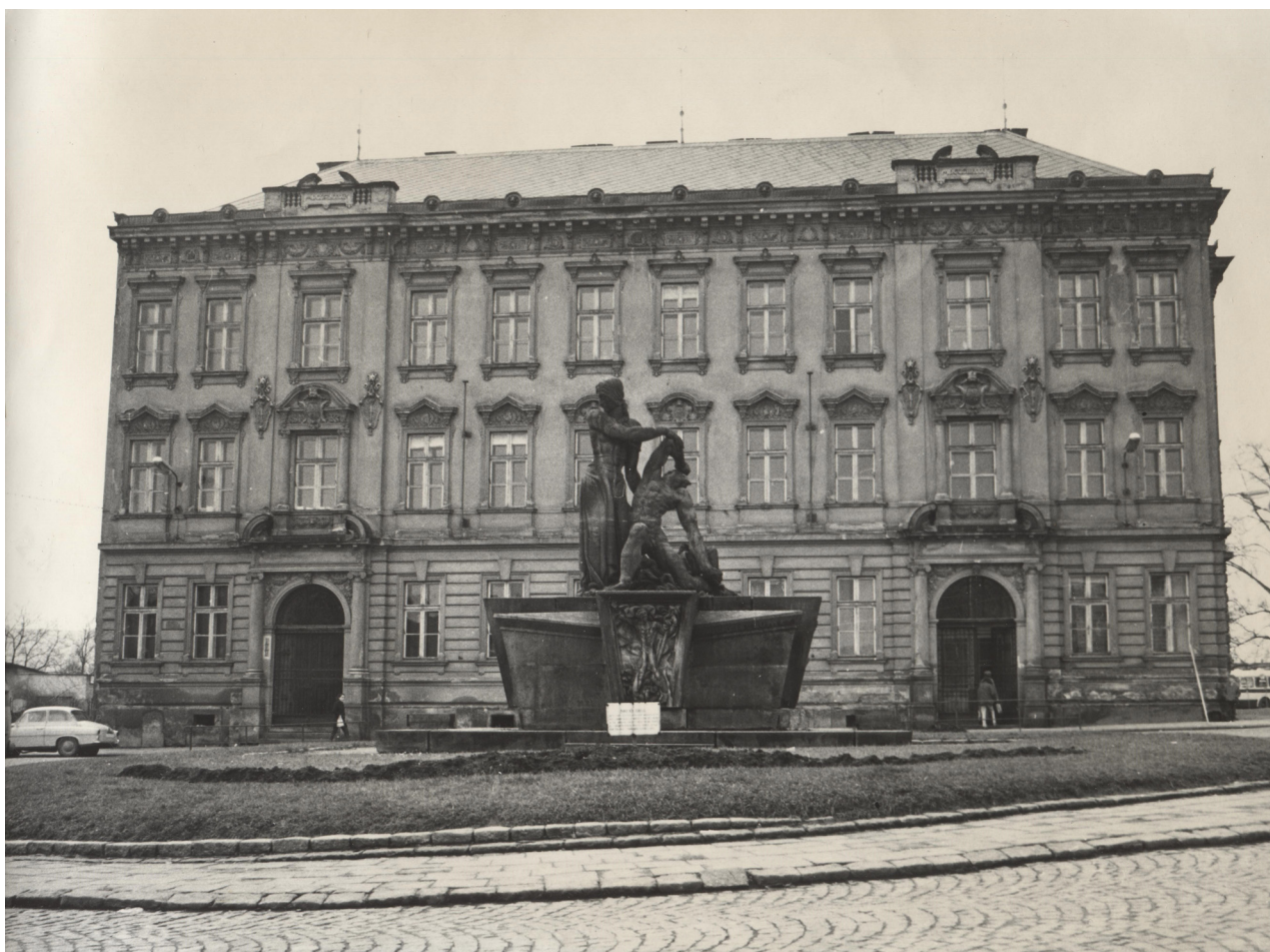
Obr. 14: Gymnázium v průběhu 60. či 70. let (archiv Městského muzea v DKnL, Gymnázium, F4/91, F1627/10, Městské muzeum DKnL).