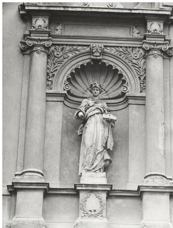
Obr. 17, 18: Postup degradace výzdoby severního průčelí, 60. léta a 80. léta.