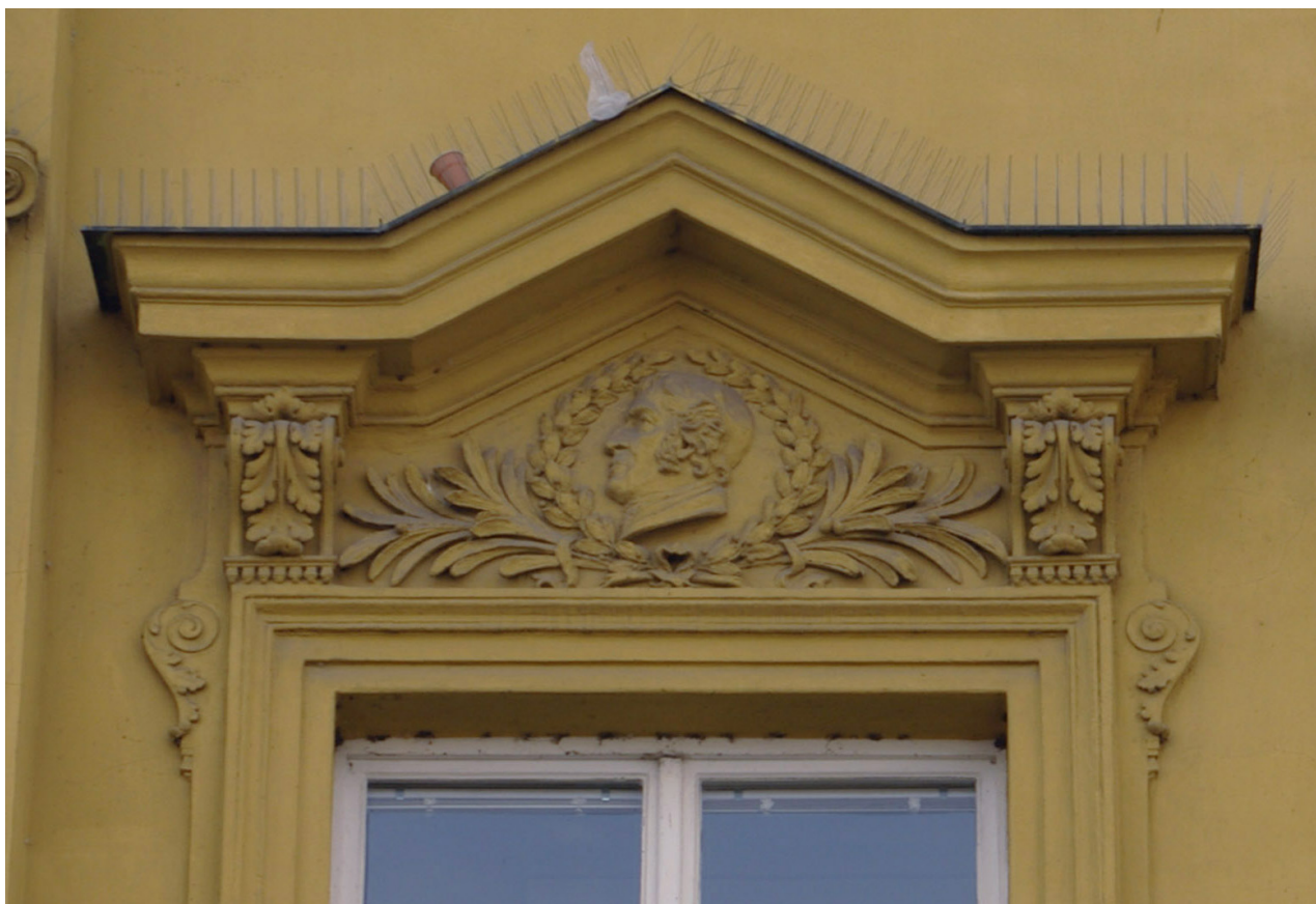
Obr. 36: Fronton jedenáctého okna východního průčelí v úrovni 2.N.P. (počítáno od jihu); v suprafenestře se nachází basrelief snad Jana Kollára (Kudrnovský, 2013).