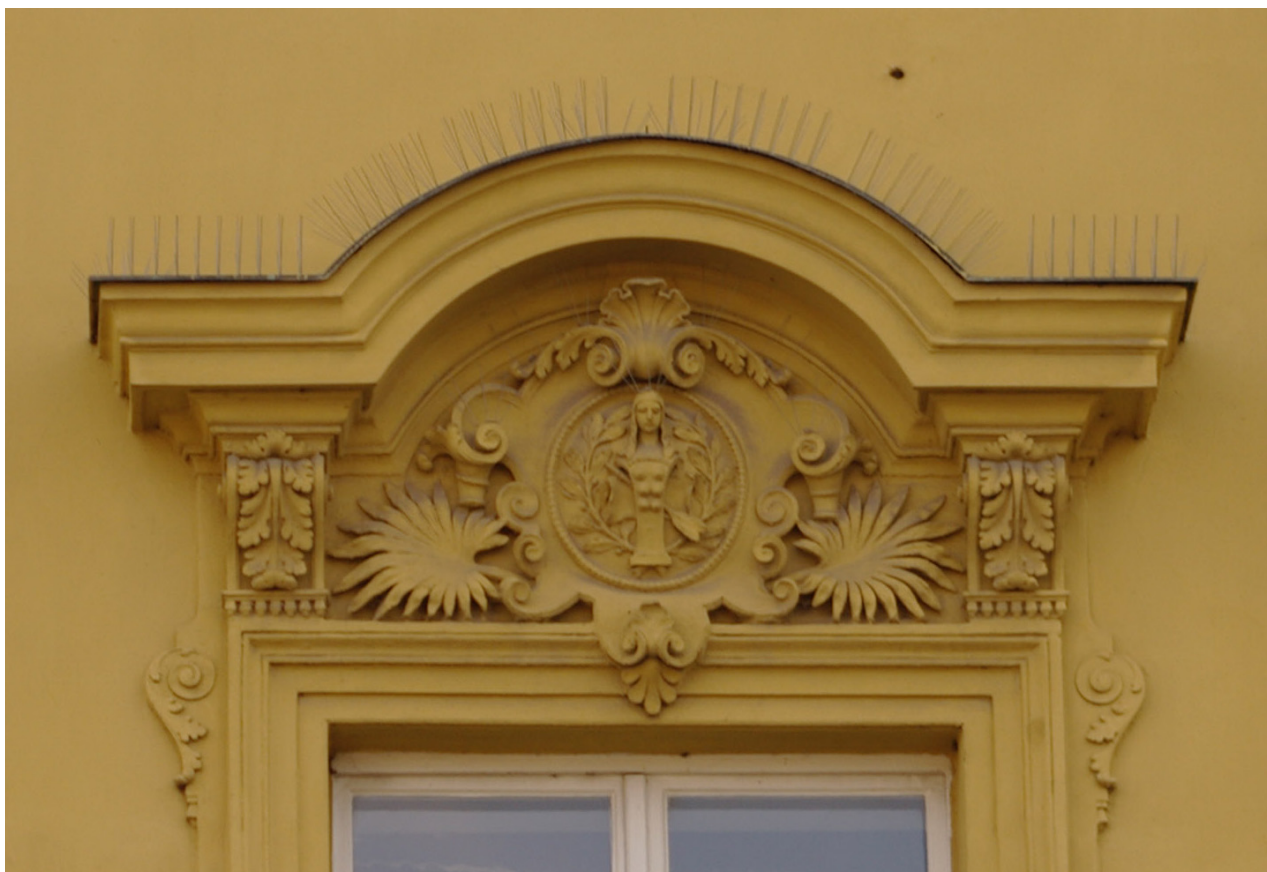
Obr. 58: Fronton pátého okna severního průčelí v úrovni 2.N.P. (počítáno od východu); v suprafenstře se nachází basrelief sochy ženy, jakožto symbolu sochařství (Kudrnovský, 2013).