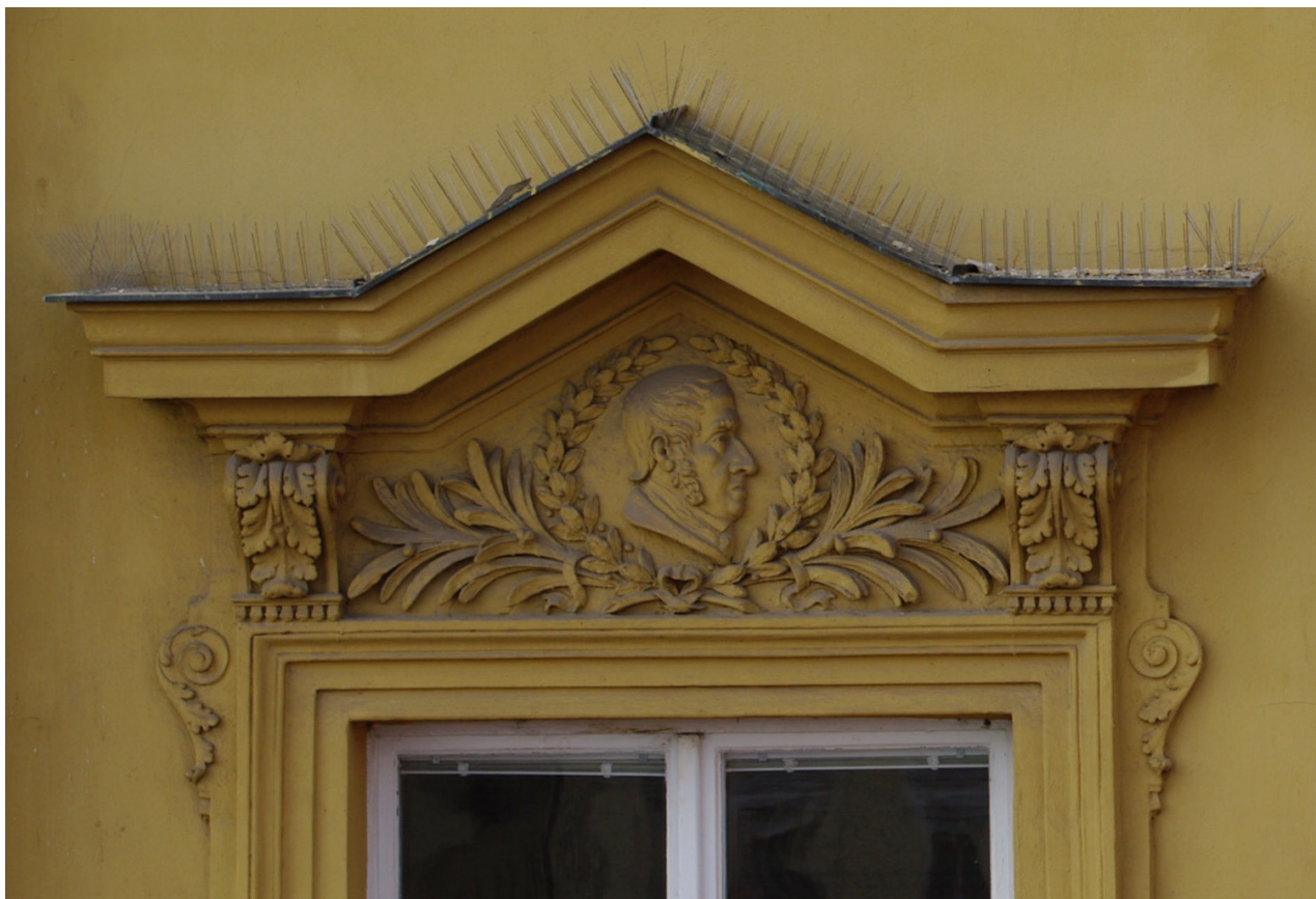
Obr. 29: Fronton čtvrtého okna východního průčelí v úrovni 2.N.P. (počítáno od jihu); v suprafenestře se nachází basreliéf pravděpodobně Františka Palackého (Kudrnovský, 2013).