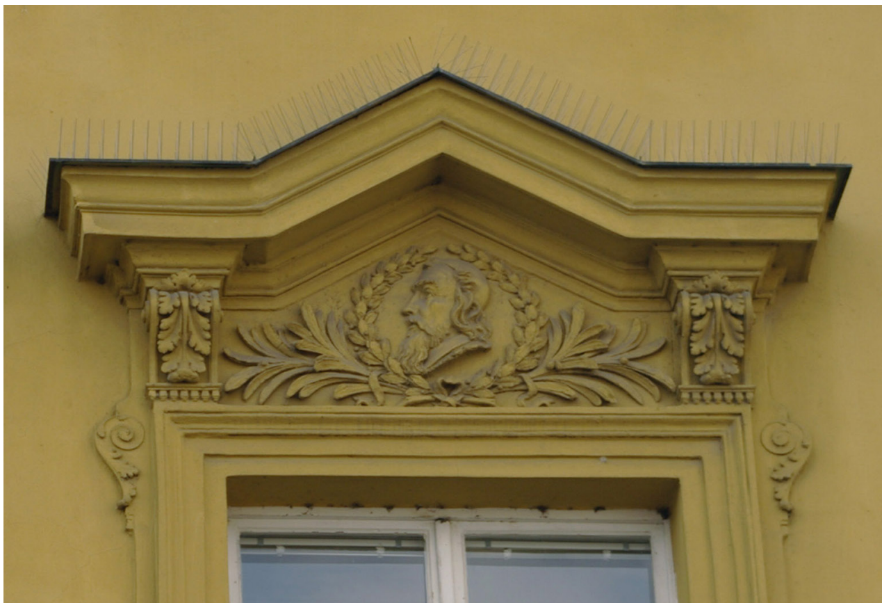
Obr. 37: Fronton dvanáctého okna východního průčelí v úrovni 2.N.P. (počítáno od jihu); v suprafenestře se nachází basrelief Jana Amose Komenského (Kudrnovský, 2013).