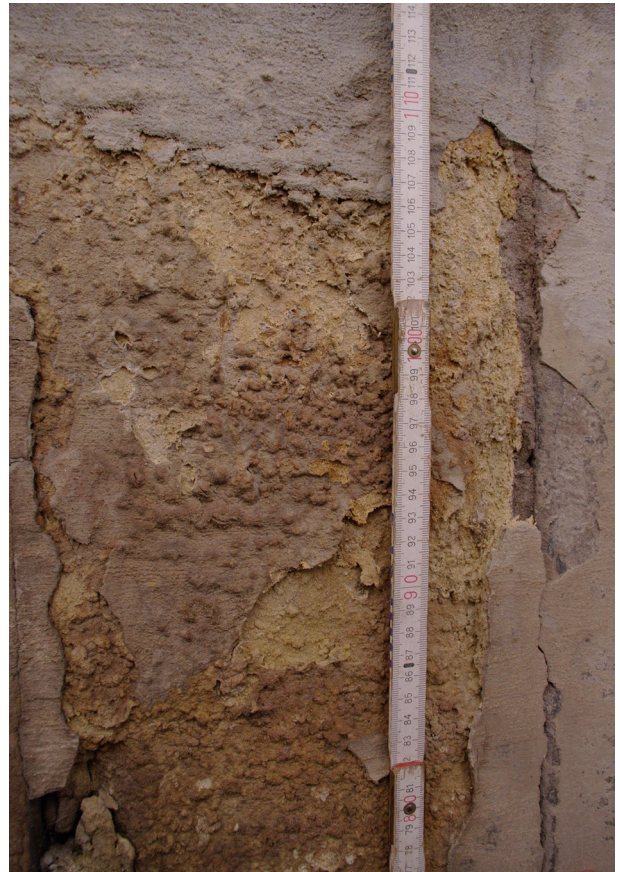
Obr. 74, 75: Pohled na degradovaný pískovcový sokl jihovýchodního nároží východního křídla budovy; detailní záběr na degradovaný pískovcový sokl téhož nároží s výkvěty solí (Kudrnovský, 2013).