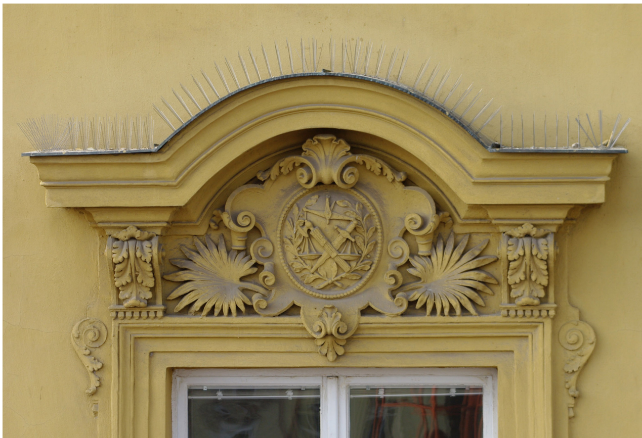
Obr. 31: Fronton šestého okna východního průčelí v úrovni 2.N.P. (počítáno od jihu); v suprafenestře se nachází basrelief symbolů vědy (Kudrnovský, 2013).