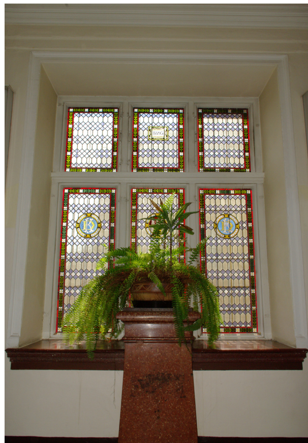
Obr. 68, 69: Původní zdobné šestikřídlé vitrajové okno osvětlující prostor schodiště (Kudrnovský, 2013).