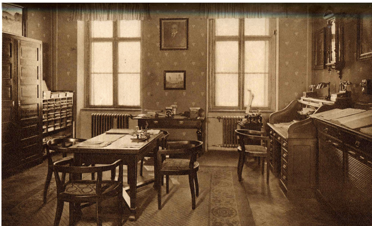
Obr. 8: Pohled do ředitelny (Neuveden: Po čtyřiceti letech. In: XXXVI výroční zpráva Státního reálného gymnasia ve Dvoře Králové nad Labem za školní rok 1929-30. Dvůr Králové nad Labem: nákladem vlastním, 1930, nestr.).