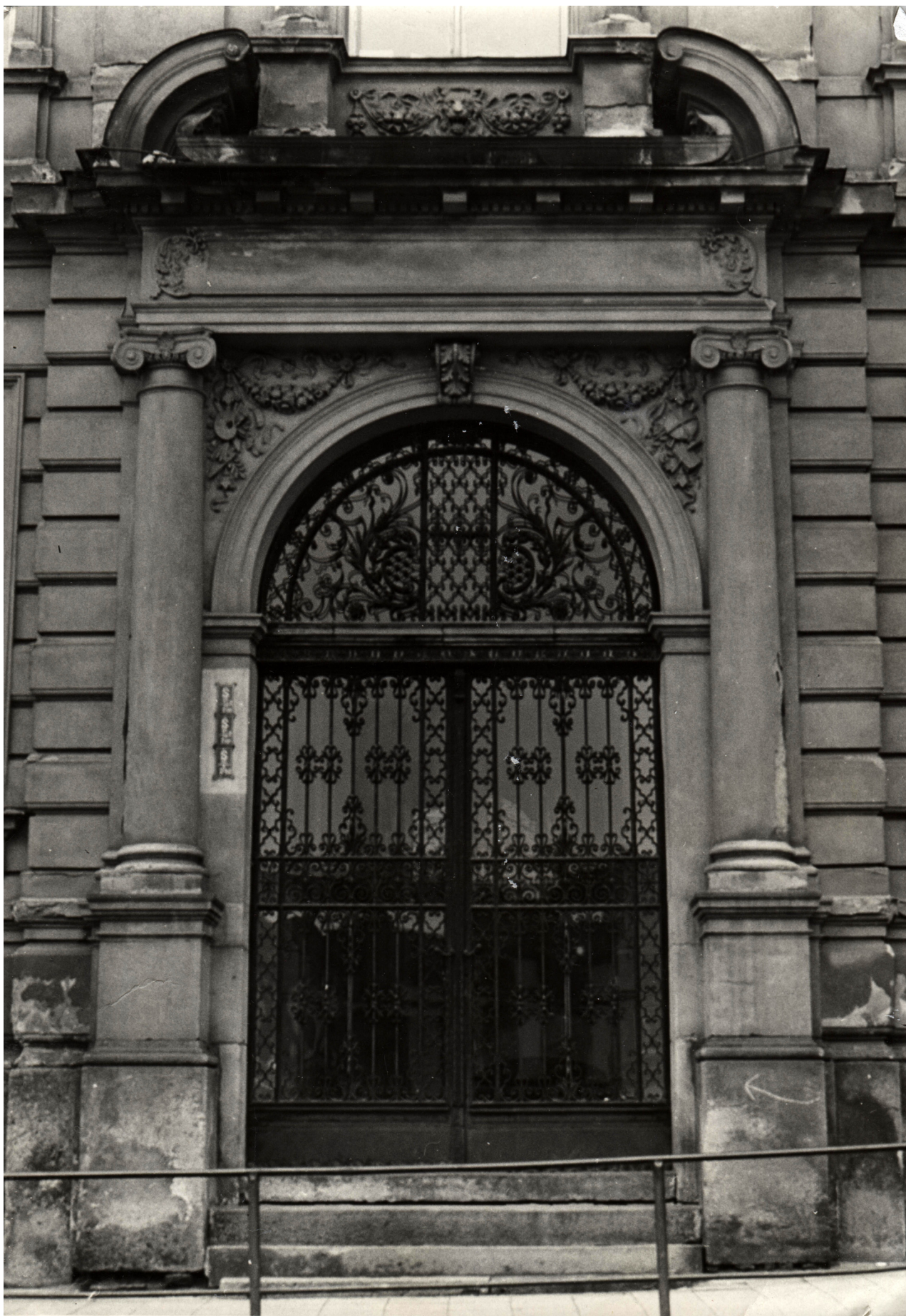
Obr. 15: Pohled na hlavní vstup do budovy gymnázia, nedatováno.