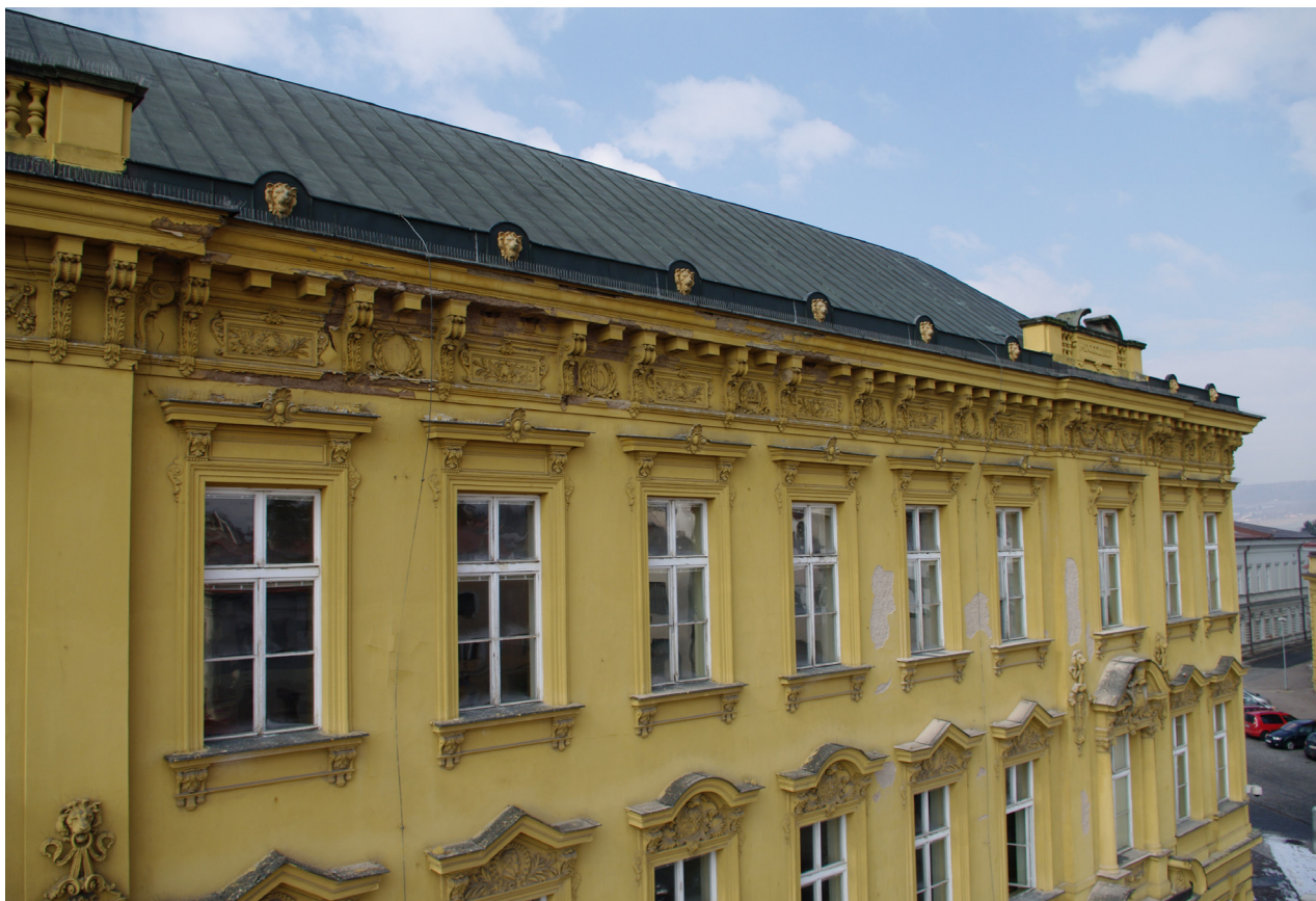
Obr. 25: Pohled na horní část východního průčelí s odstraněnou opadávající omítkou a nestabilní štukovou výzdobou; atika, korunní římsa a vlys pod korunní římsou jsou již v současnosti obnoveny (Kudrnovský, 2013).