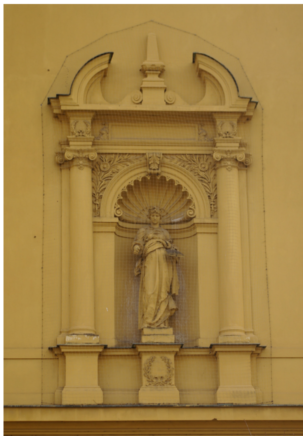
Obr. 51, 52: Západní část severní fasády s edikulou v níž je osazena alegorie vědy (Kudrnovský, 2013).