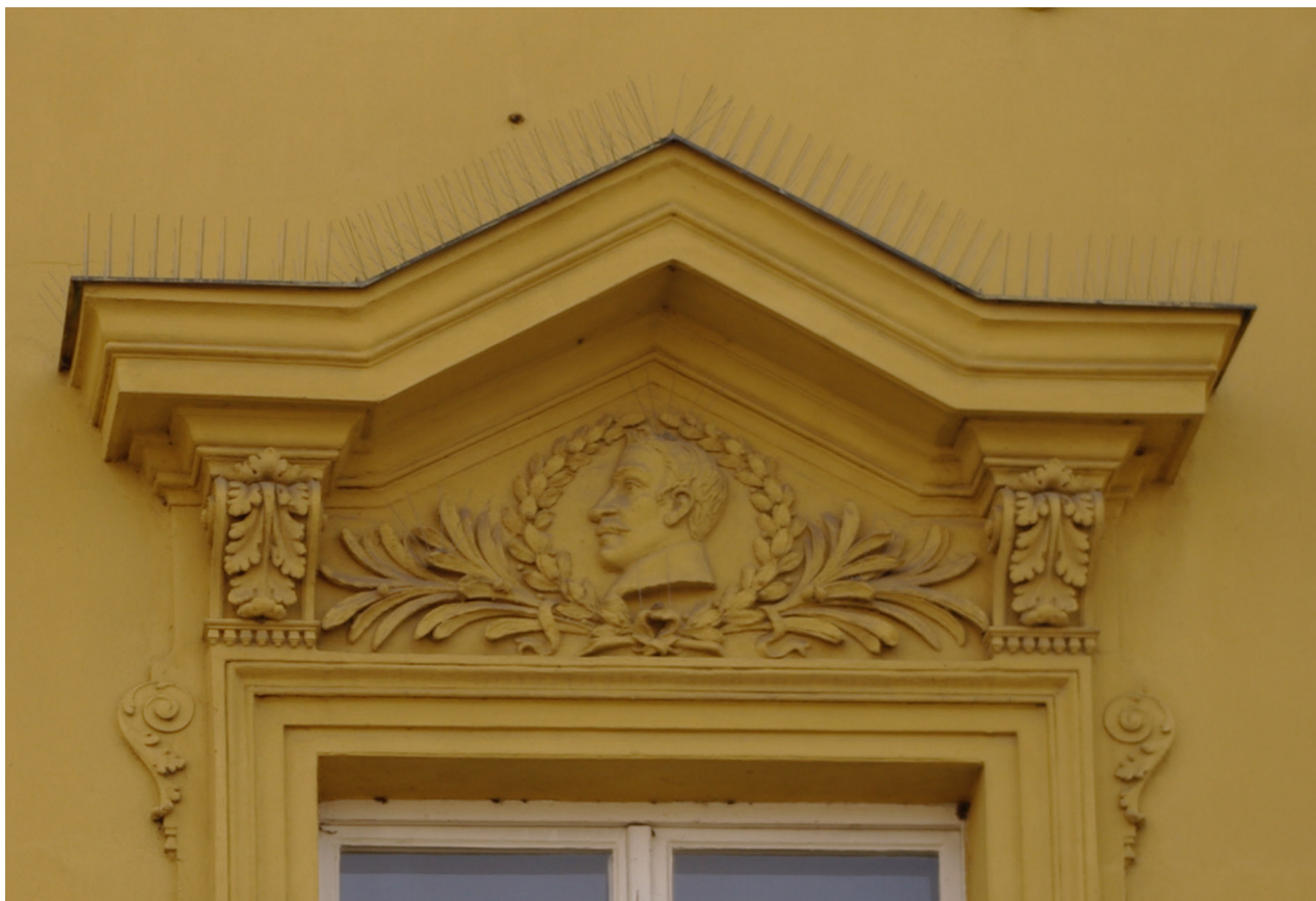
Obr. 63: Fronton desátého okna severního průčelí v úrovni 2.N.P. (počítáno od východu); v suprafenstře se nacházejí basreliéf snad Karla staršího ze Žerotína (Kudrnovský, 2013).