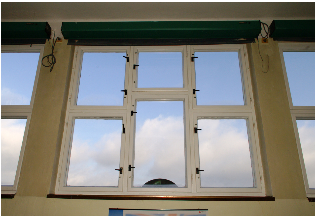
Obr. 66: Novodobá okenní výplň nadstavby severního průčelí (Kudrnovský, 2013).