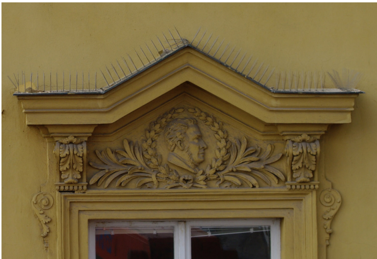
Obr. 30: Fronton pátého okna východního průčelí v úrovni 2.N.P. (počítáno od jihu); v suprafenestře se nachází basrelief Pavla Josefa Šafaříka (Kudrnovský, 2013).