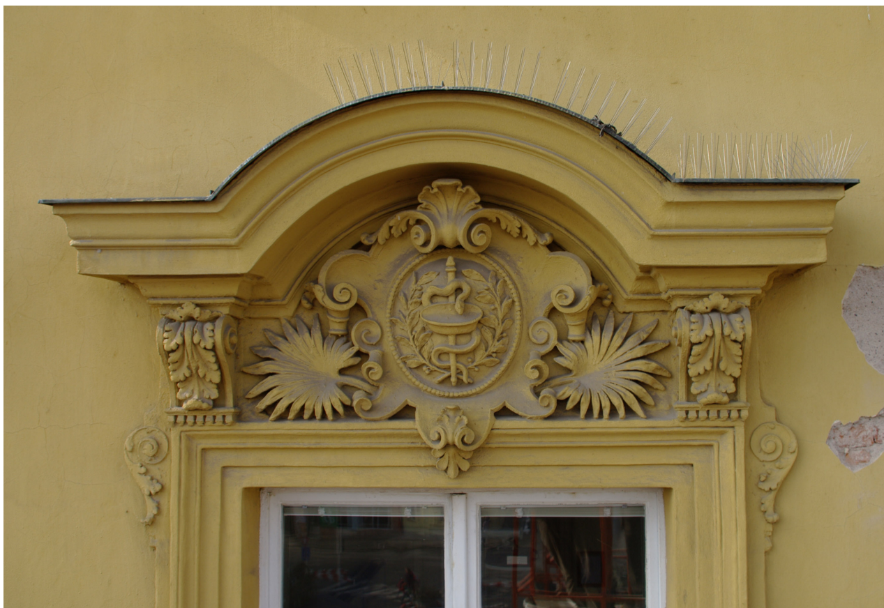
Obr. 32: Fronton sedmého okna východního průčelí v úrovni 2.N.P. (počítáno od jihu); v suprafenstře se nachází basreliéf hada, jakožto symbolu vědy (Kudrnovský, 2013).