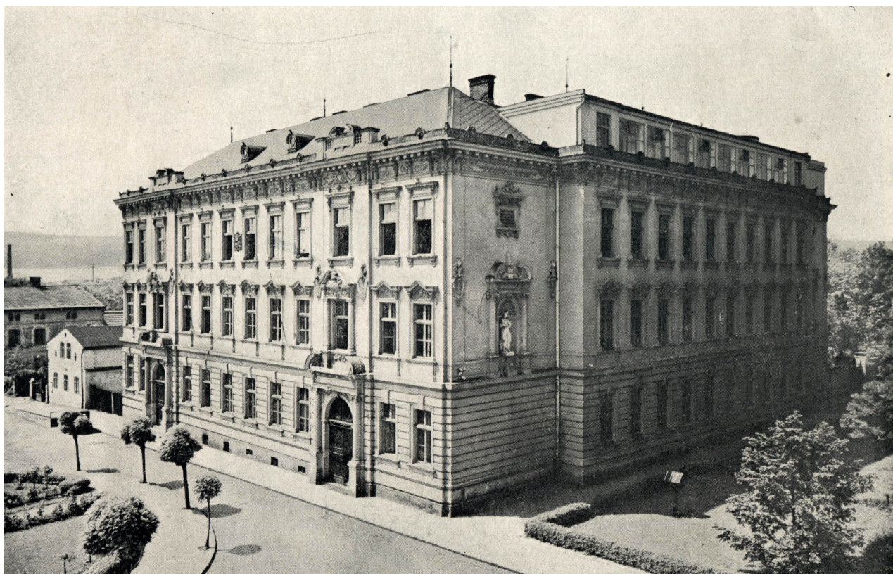
Obr. 11: Budova gymnázia po zbudování nové nástavby a hvězdářského pavilonu (Neuveden. In: XXXIX výroční zpráva Státního čsl. reálného gymnasia ve Dvoře Králové nad Labem za školní rok 1932-33. Dvůr Králové nad Labem: nákladem vlastním, 1933, nestr.).