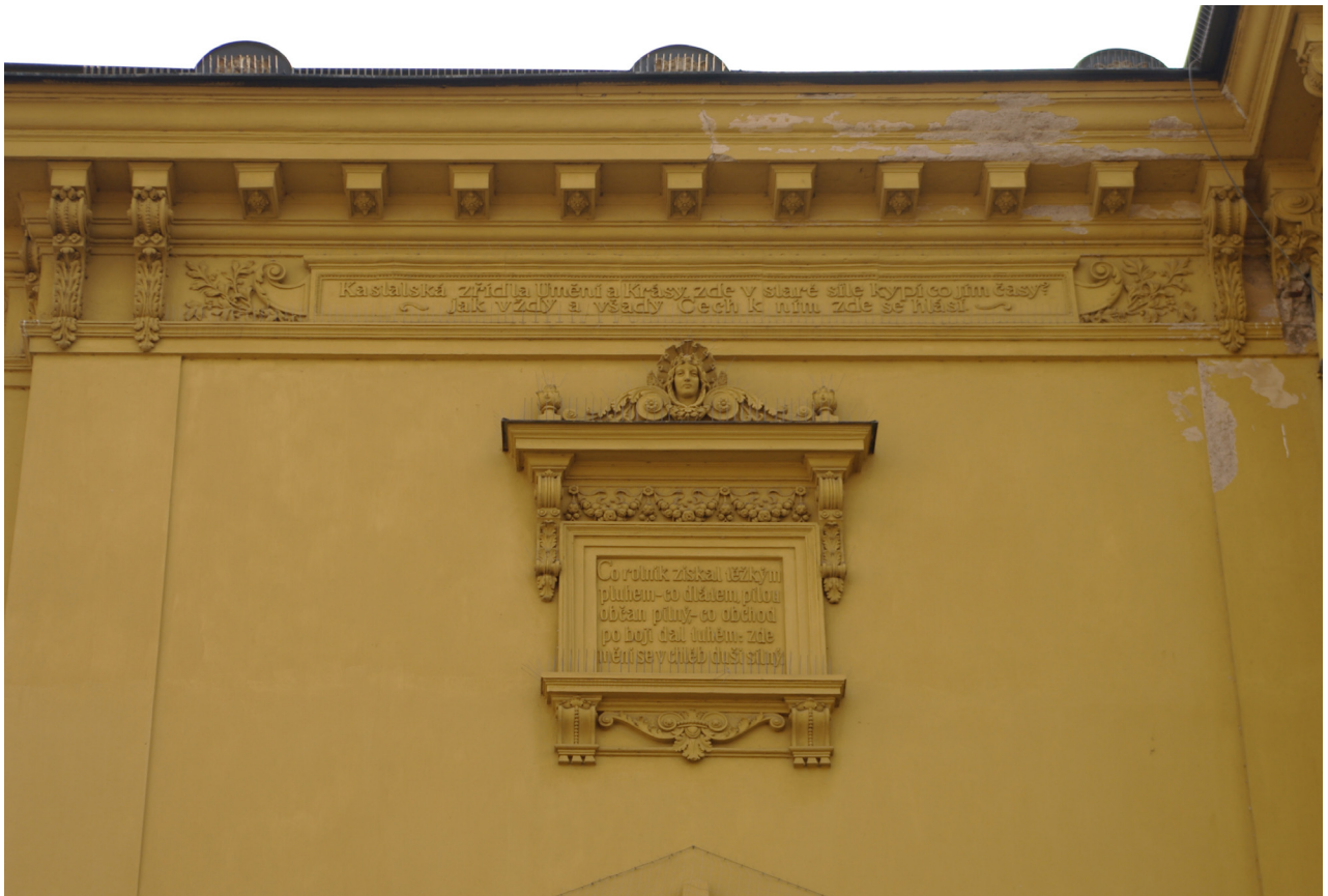
Obr. 50: Východní část severní fasády s plasticky zdobenými kartušemi s texty Jaroslava Vrchlického (Kudrnovský, 2013).