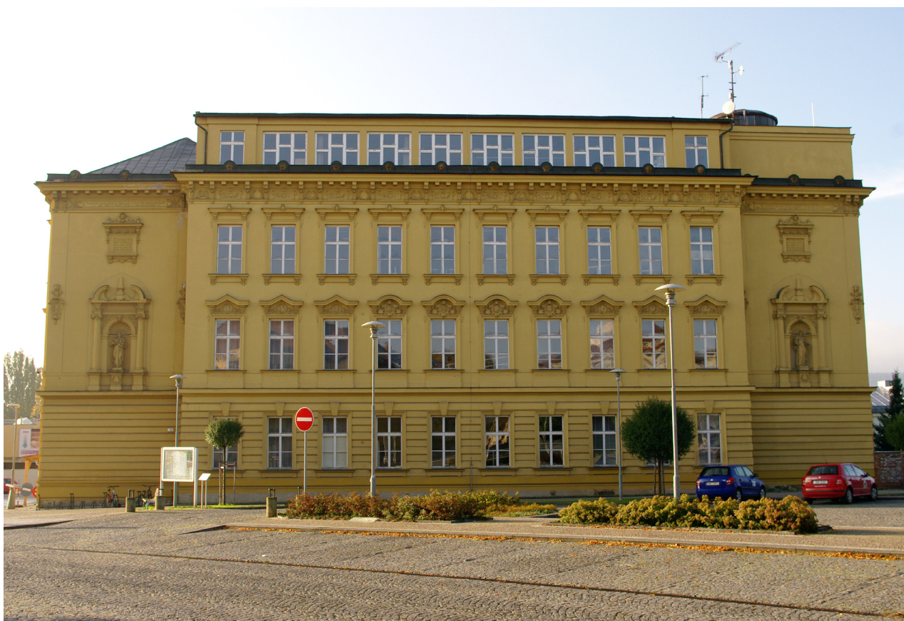
Obr. 47: Pohled na severní průčelí budovy gymnázia (Kudrnovský, 2013).