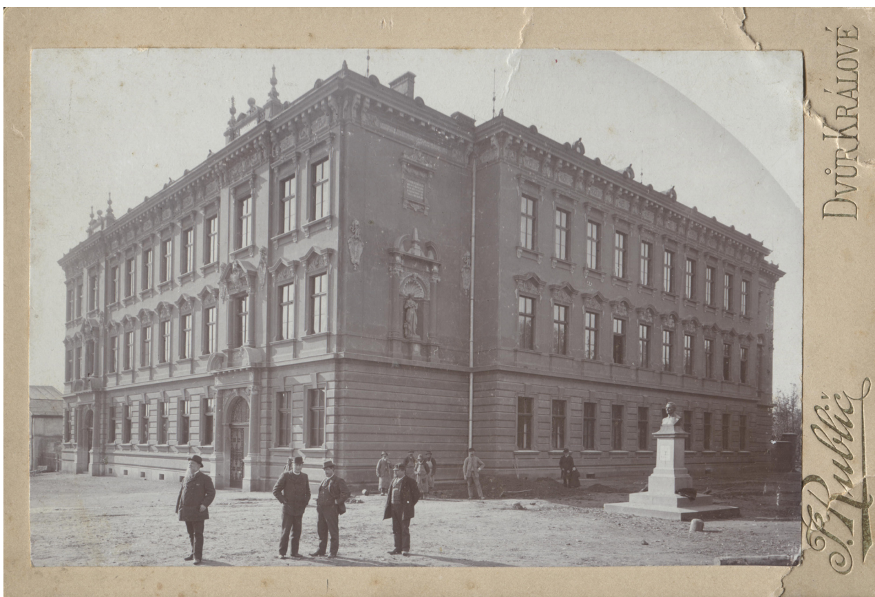
Obr. 2: Nově postavená budova gymnázia, v popředí doposud holé prostranství bez parkové úpravy a pomník Václava Hanky, 1895?.