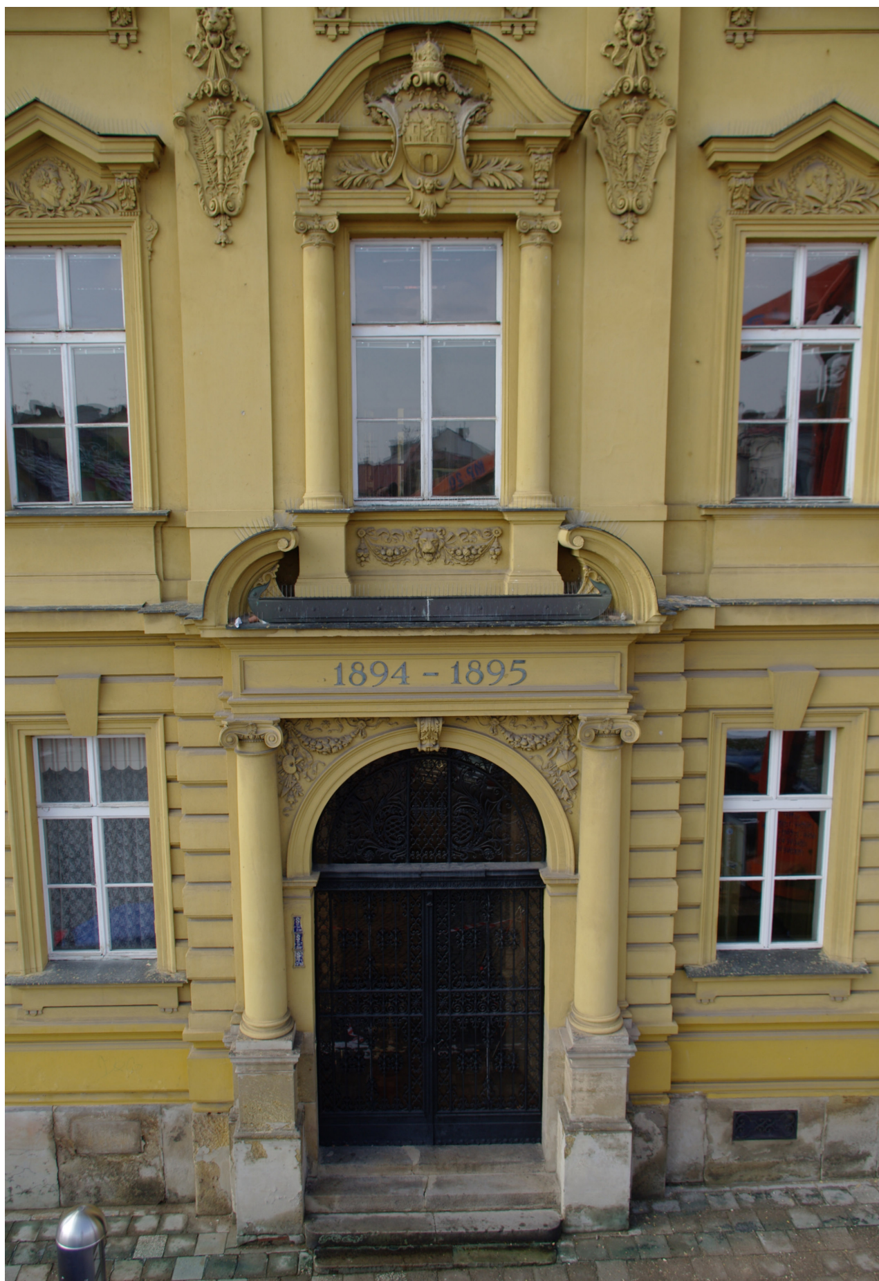
Obr. 45: Mělký rizalit východního průčelí se vstupní edikulou (Kudrnovský, 2013).