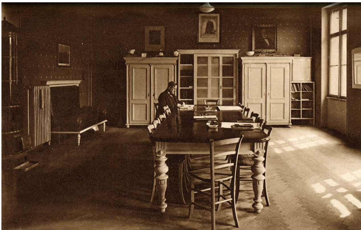
Obr. 9: Pohled do sborovny (Neuveden: Po čtyřiceti letech. In: XXXVI výroční zpráva Státního reálného gymnasia ve Dvoře Králové nad Labem za školní rok 1929-30. Dvůr Králové nad Labem: nákladem vlastním, 1930, nestr.).