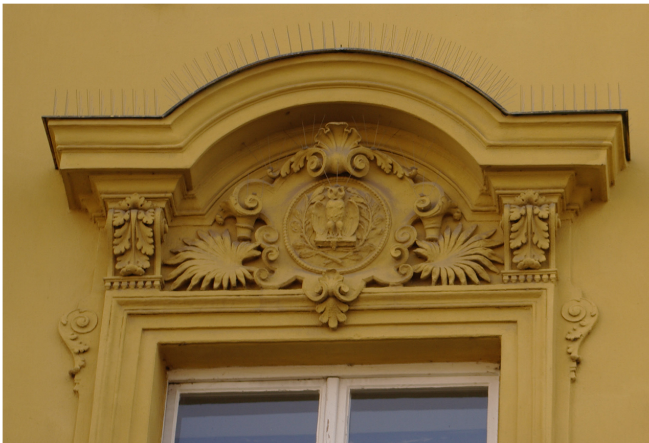
Obr. 57: Fronton čtvrtého okna severního průčelí v úrovni 2.N.P. (počítáno od východu); v suprafenestře se nachází basrelief sovy, jakožto symbolu vědy (Kudrnovský, 2013).