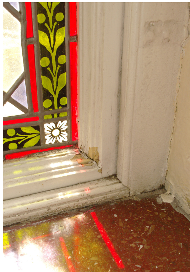
Obr. 70, 71: Detaily profilací původního vitrajového okna (Kudrnovský, 2013).