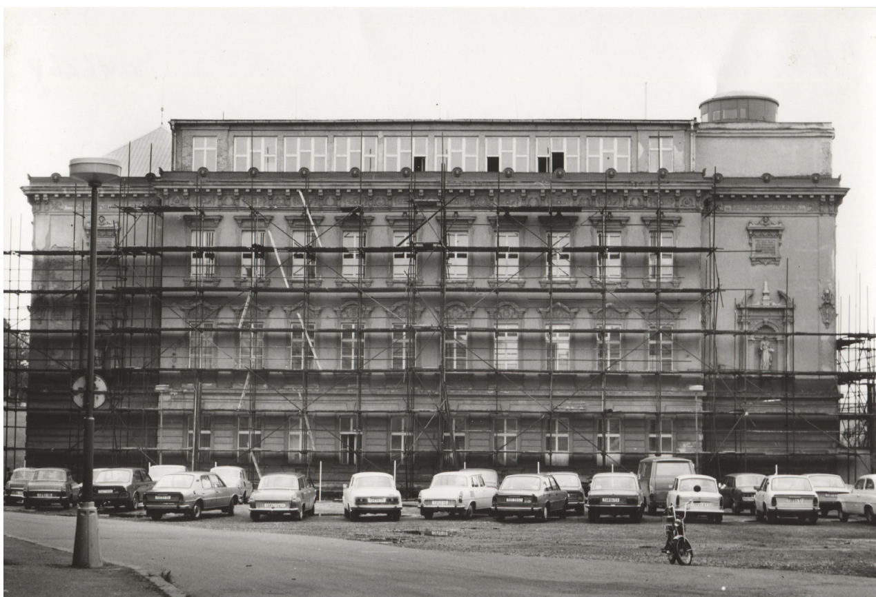
Obr. 21: Oprava fasády severního průčelí, konec 80. let (archiv Městského muzea v DKnL, Gymnázium, F3/91, F1626/3 Městské muzeum DKnL).