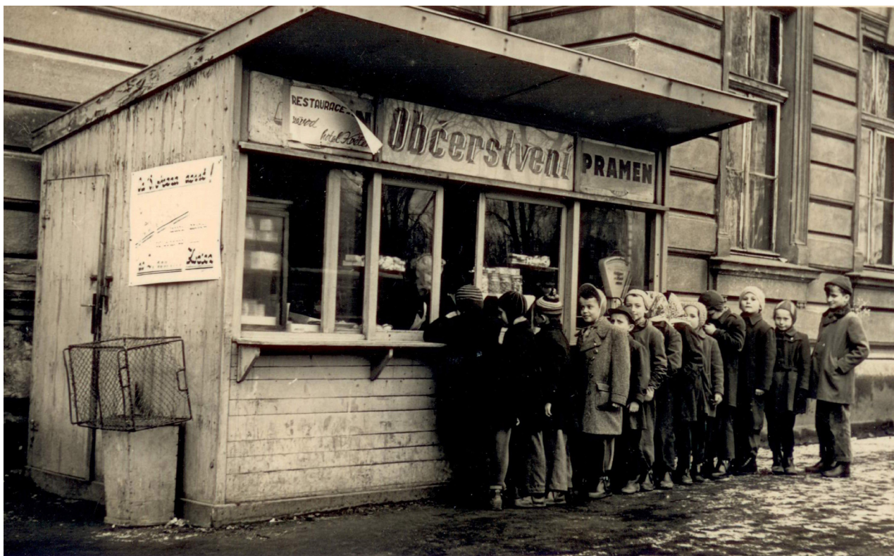
Obr. 13: Detailní pohled na okna v severním průčelí budovy gymnázia, 50. - 60. léta.