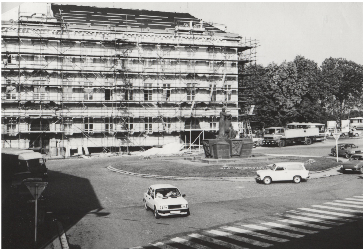
Obr. 22: Oprava fasády východního průčelí, konec 80. let.