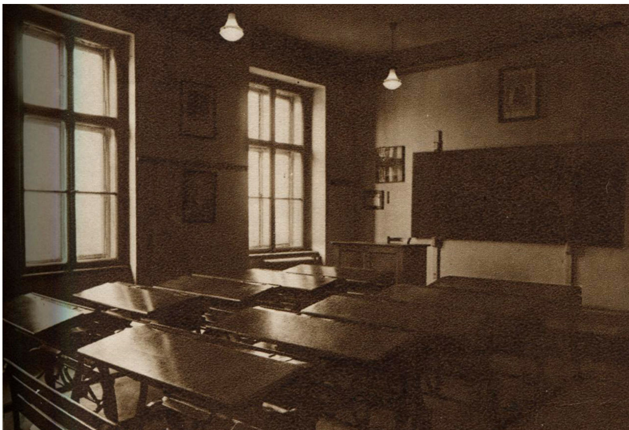
Obr. 7: Učebna VIII. třídy (Neuveden: Po čtyřiceti letech. In: XXXVI výroční zpráva Státního reálného gymnasia ve Dvoře Králové nad Labem za školní rok 1929-30. Dvůr Králové nad Labem: nákladem vlastním, 1930, nestr.).