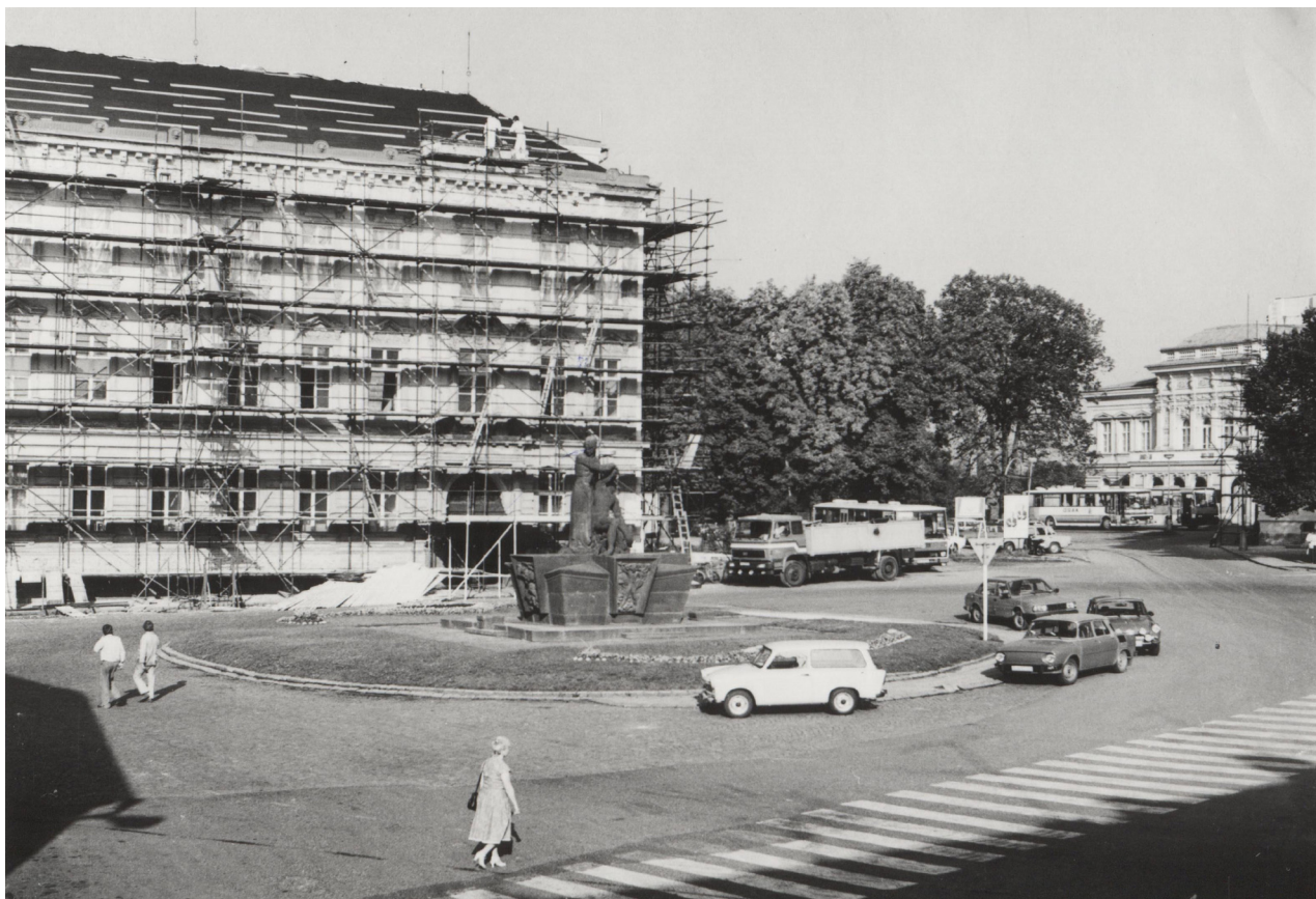
Obr. 23: Oprava fasády východního průčelí, konec 80. let.