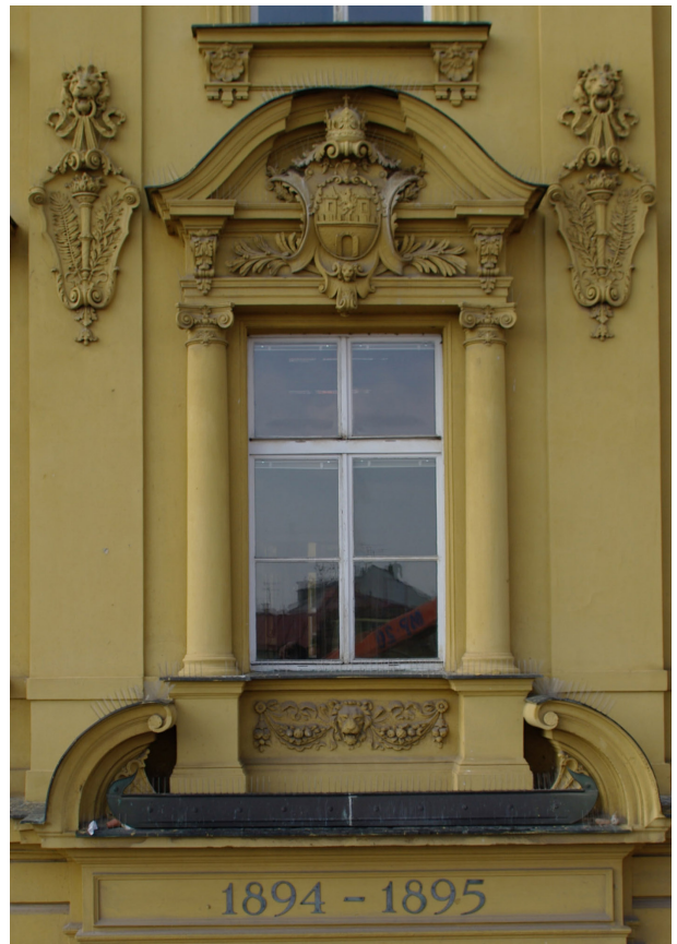
Obr. 40, 41: Okna východního a severního průčelí v úrovni 2.N.P.; vpravo okno situované v jednom z mělkých rizalitů (Kudrnovský, 2013).