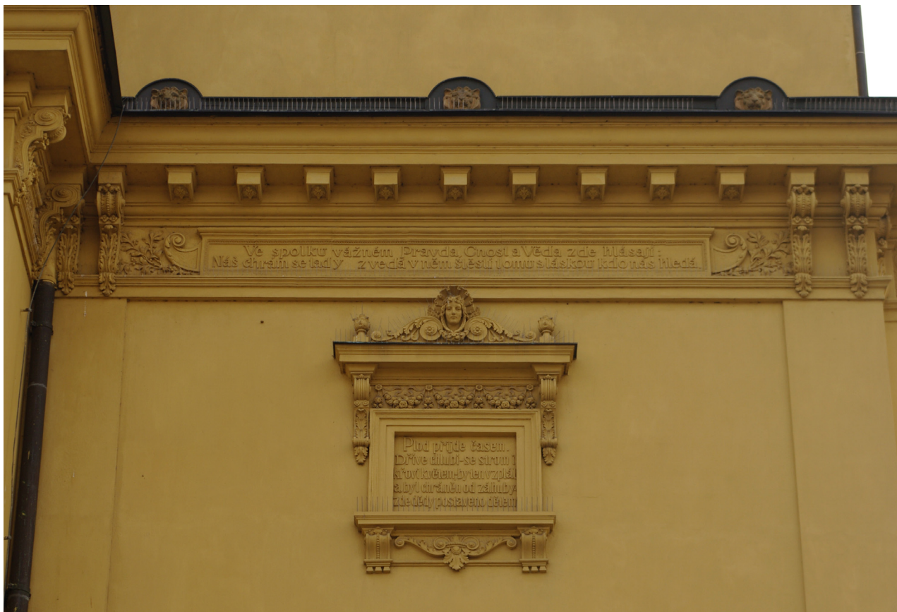
Obr. 53: Západní část severní fasády s plasticky zdobenými kartušemi s texty Jaroslava Vrchlického (Kudrnovský, 2013).