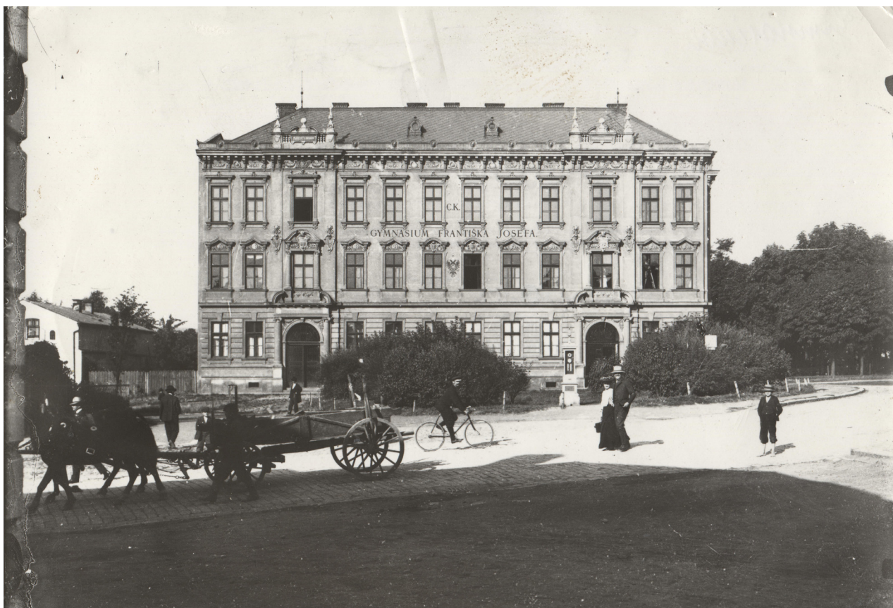
Obr. 4: Pohled na východní průčelí budovy gymnázia, nedatováno.