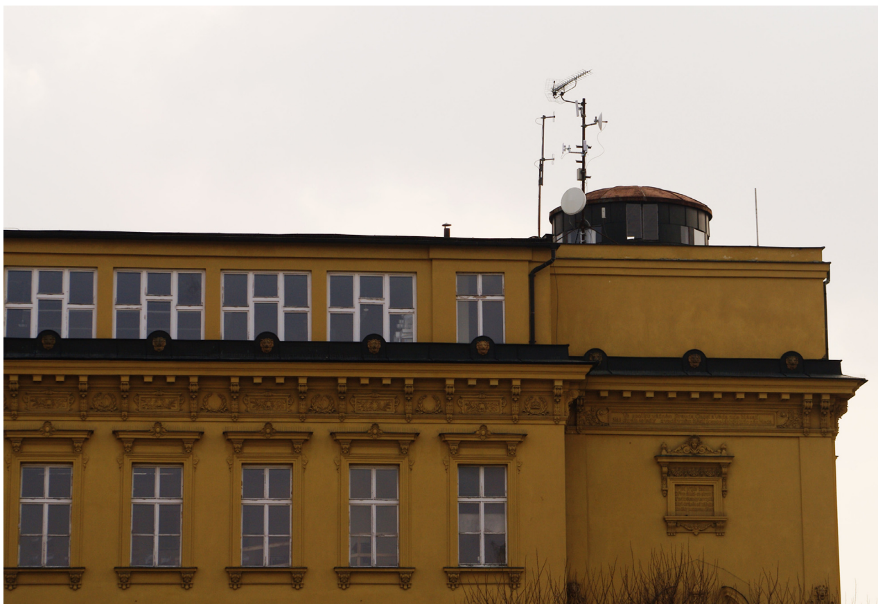
Obr. 64: Pohled na část severního průčelí s nadstavbou a hvězdárnou (Kudrnovský, 2013).