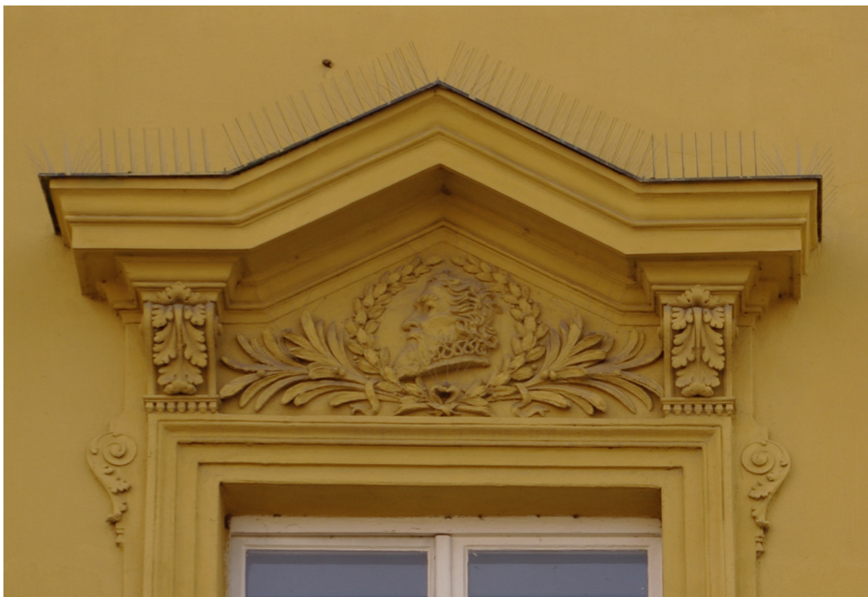
Obr. 62: Fronton devátého okna severního průčelí v úrovni 2.N.P. (počítáno od východu); v suprafenstře se nacházejí basreliéf snad Viktorina Kornela ze Všehrd (Kudrnovský, 2013).