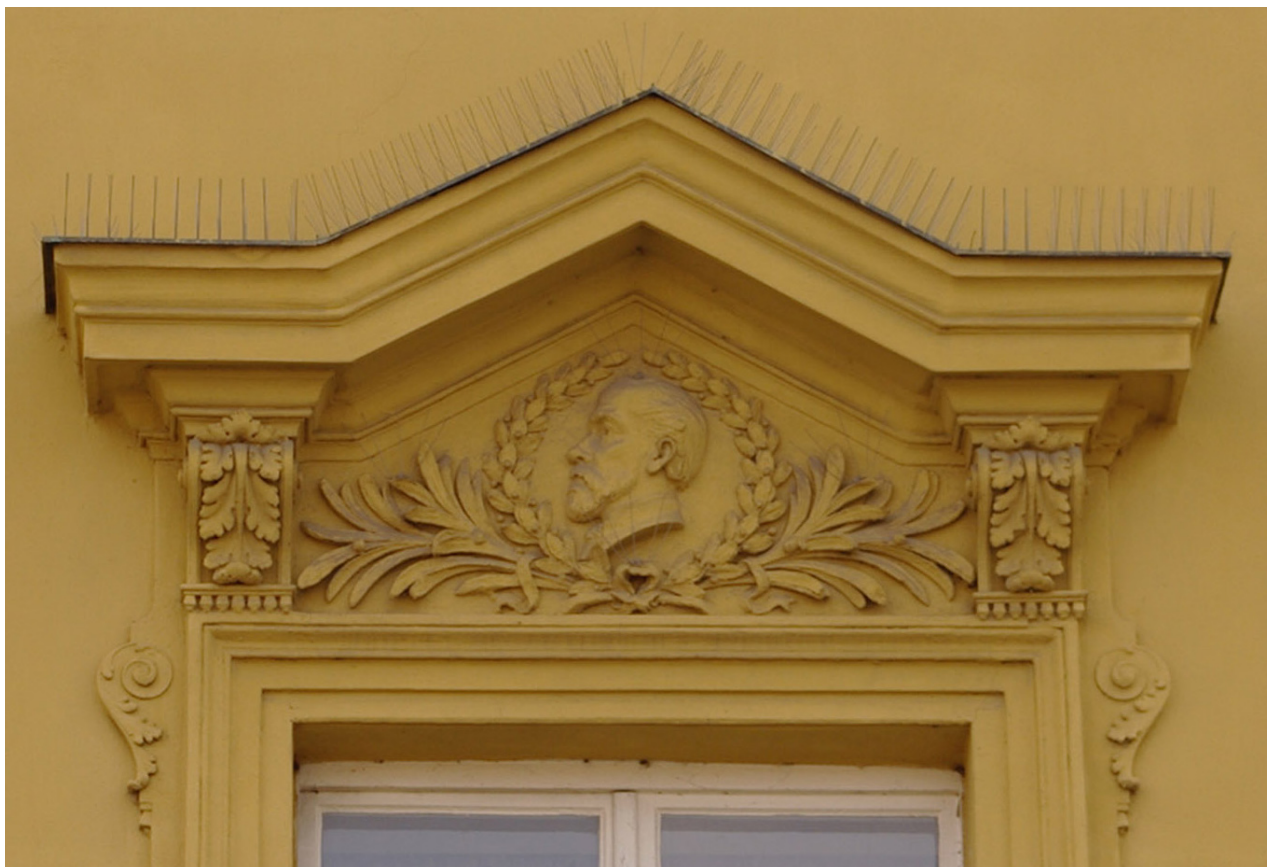
Obr. 61: Fronton osmého okna severního průčelí v úrovni 2.N.P. (počítáno od východu); v suprafenstře se nachází basrelief snad Karla Hynka Máchy (Kudrnovský, 2013).