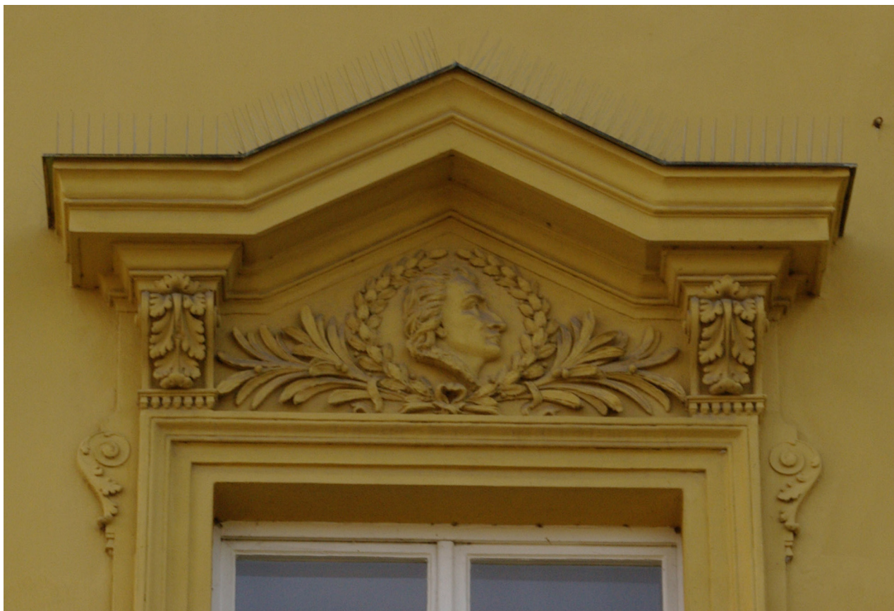
Obr. 55: Fronton druhého okna severního průčelí v úrovni 2.N.P. (počítáno od východu); v suprafenestře se nachází nerozpoznaný basreliéf (Kudrnovský, 2013).