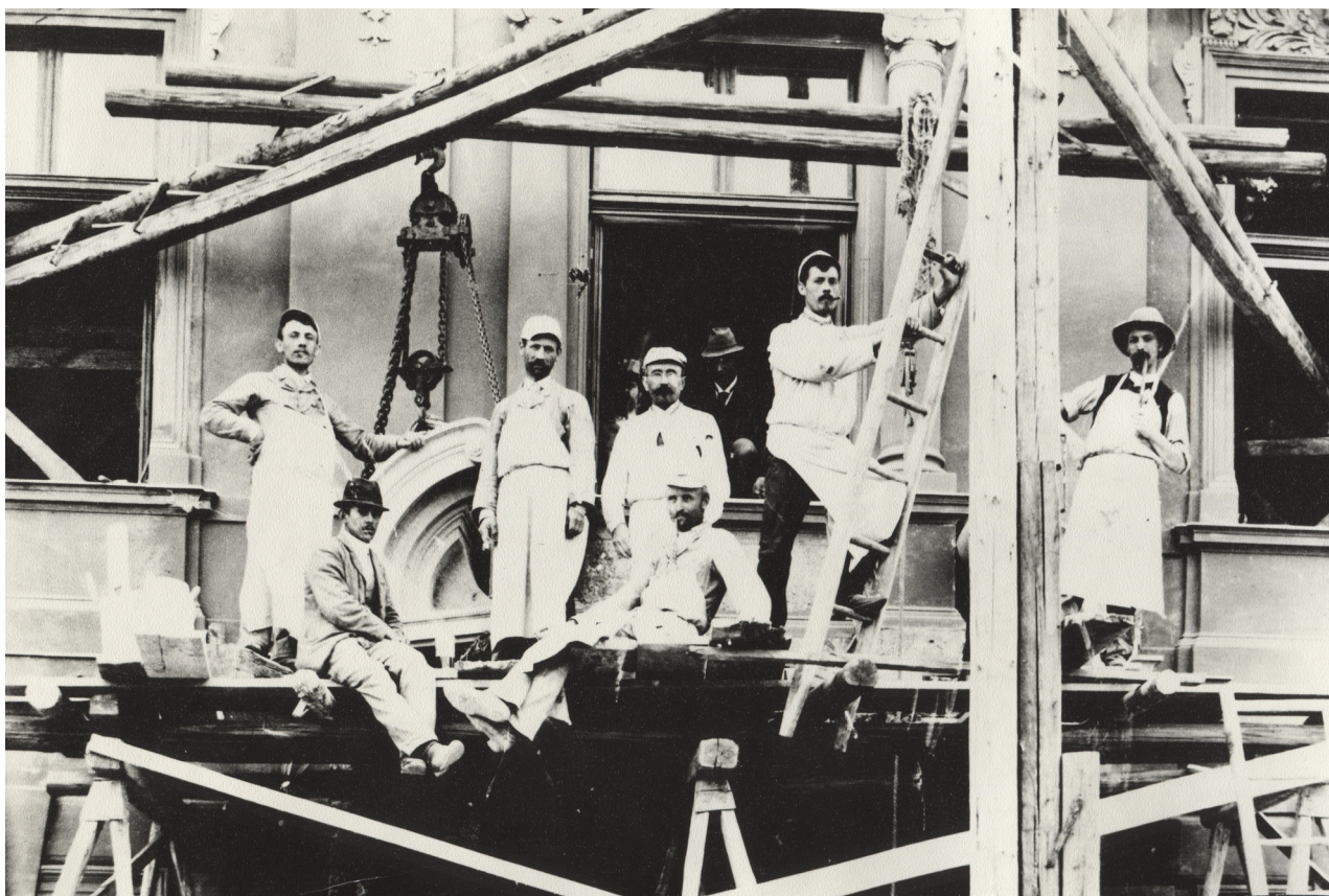
Obr. 1: Stavba nové budovy gymnázia (archiv Městského muzea v DKnL, Gymnázium, F4/91, F1627/6 Městské muzeum DKnL).