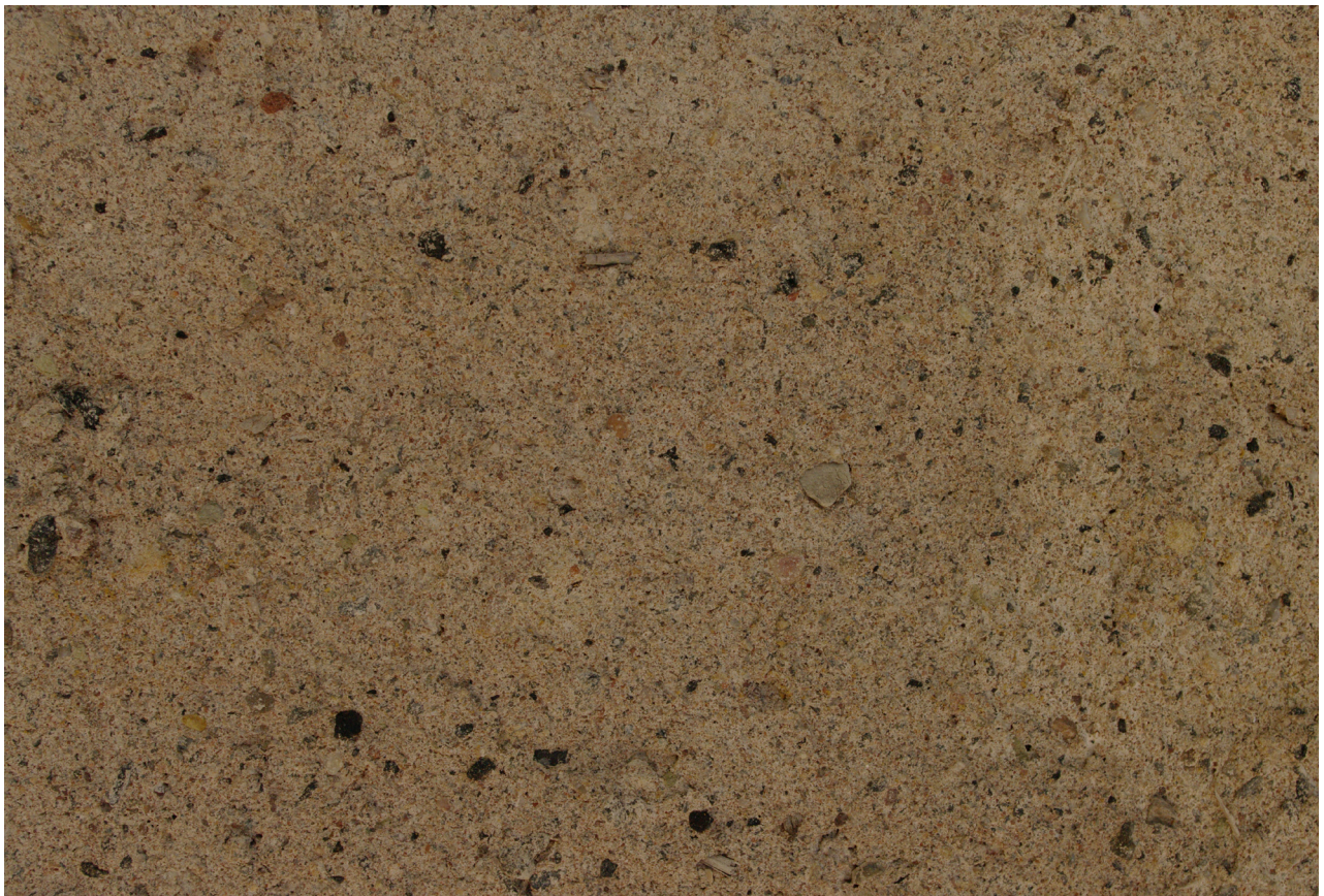
Obr. 73: Jádrová omítka s příměsí drcené pálené keramiky a drceného dřevěného uhlí (Kudrnovský, 2013).