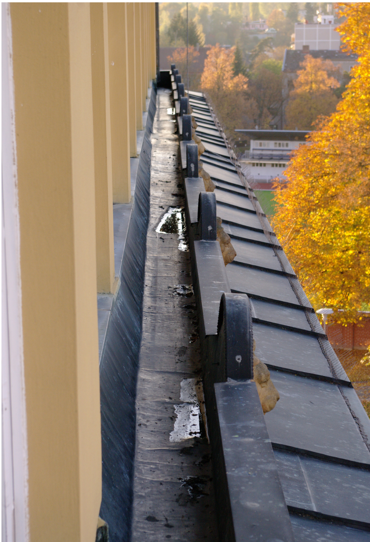
Obr. 77: Zaatikový žlab severního průčelí (Kudrnovský, 2013).