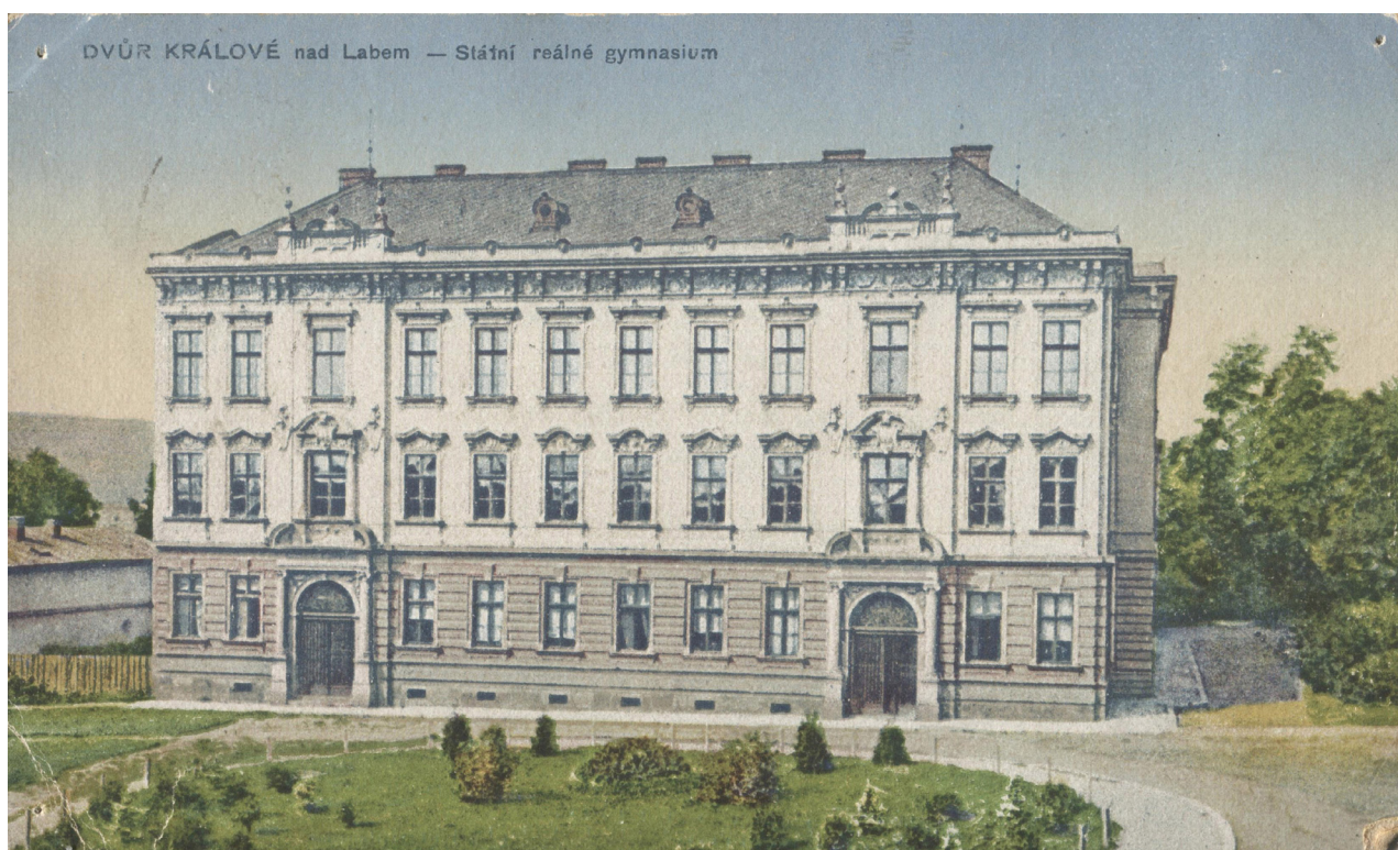
Obr. 5: Pohlednice zachycující budovu Státního reálného gymnázia, vytištěno v roce 1919 (archiv Městského muzea v DKnL, Geislerova sbírka, Gymnázium, 160/99, Městské muzeum DKnL).