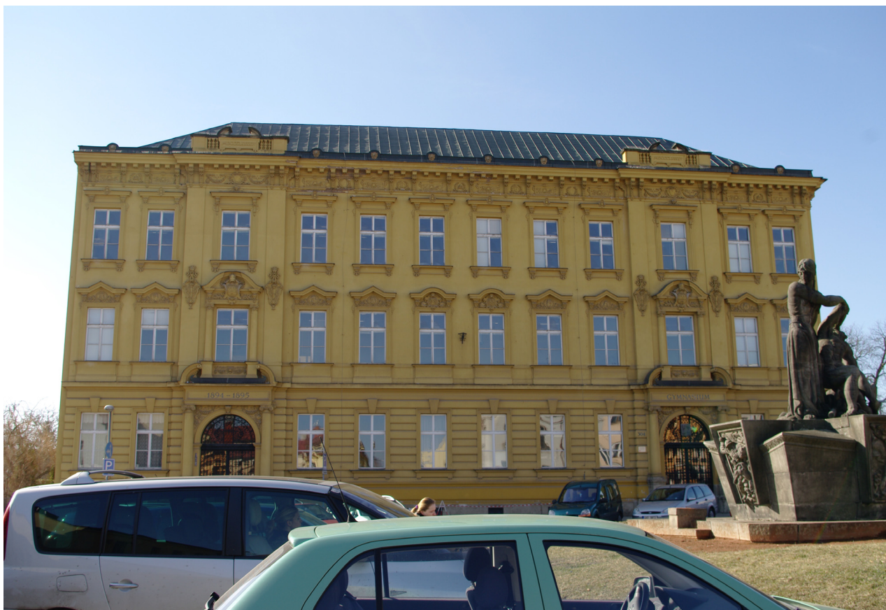
Obr. 24: Pohled na hlavní (východní) průčelí budovy gymnázia (Kudrnovský, 2012).