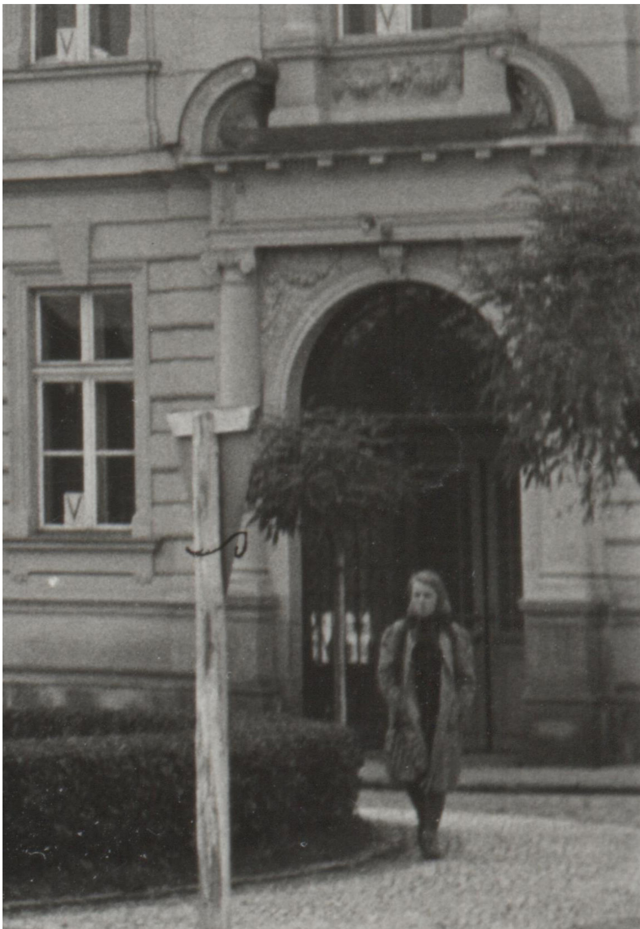
Obr. 16: Fotografie zachycující hlavní vstup do budovy a původní prosklenou stěnu vestibulu, po roce 1942, před rokem 1945 (archiv Městského muzea v DKnL, Geislerova sbírka, Protektorát, 7153/99 - výřez, Městské muzeum DKnL).