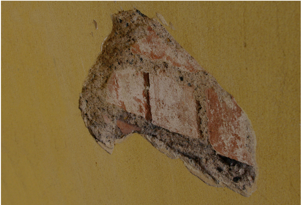
Obr. 72: Charakteristické poškození hladkých omítkových ploch (Kudrnovský, 2013).