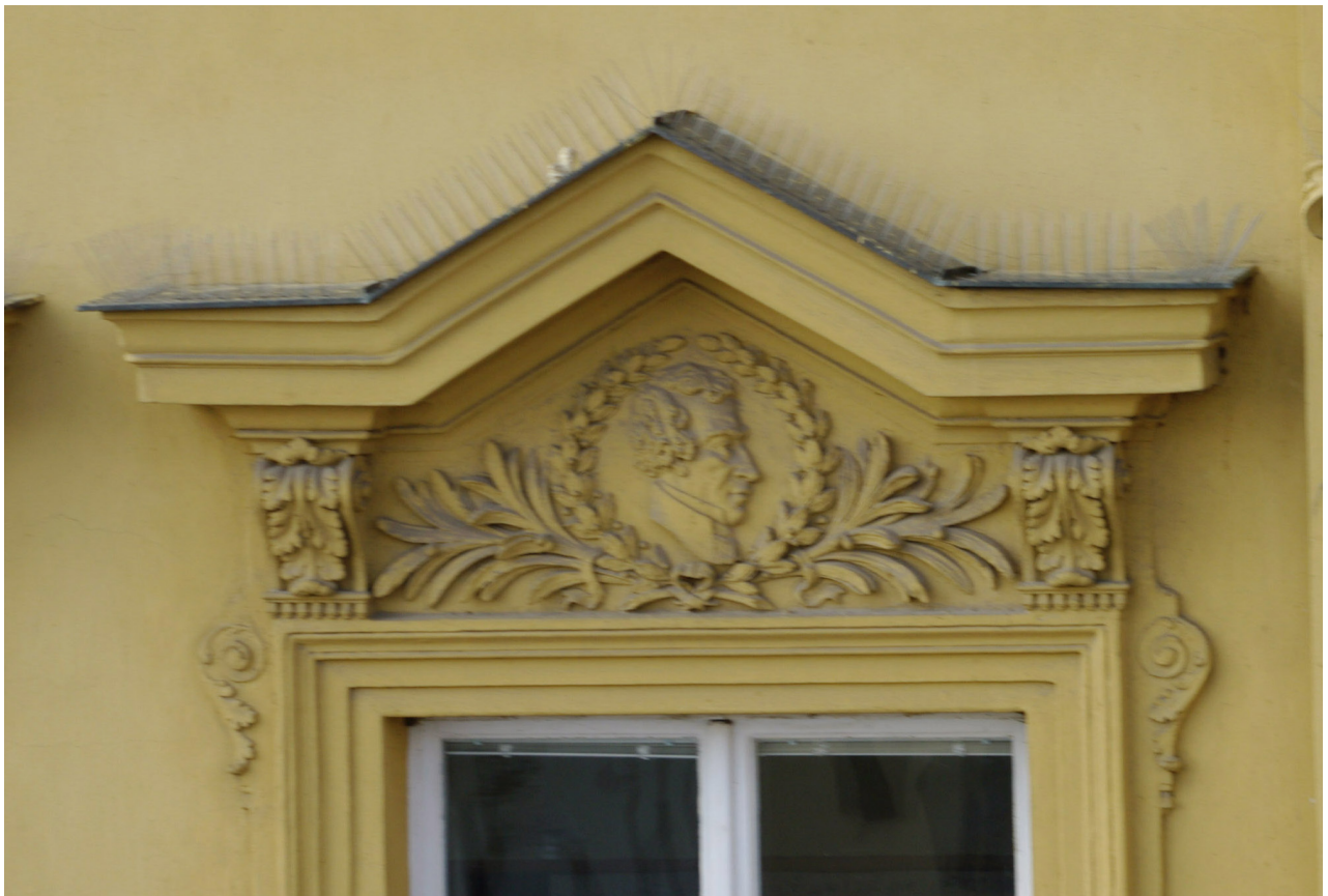
Obr. 27: Fronton druhého okna východního průčelí v úrovni 2.N.P. (počítáno od jihu); v suprafenstře se nachází basreliéf pravděpodobně Josefa Jungmanna (Kudrnovský, 2013).