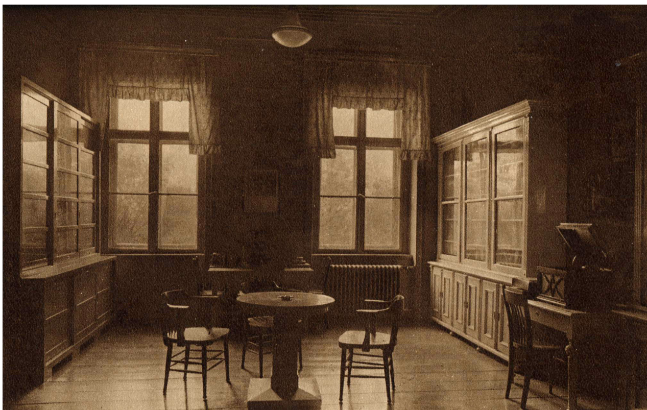
Obr. 10: Hovorna (Neuveden: Po čtyřiceti letech. In: XXXVI výroční zpráva Státního reálného gymnasia ve Dvoře Králové nad Labem za školní rok 1929-30. Dvůr Králové nad Labem: nákladem vlastním, 1930, nestr.).