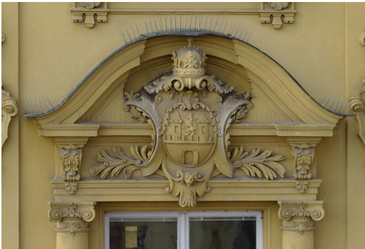
Obr. 35: Fronton desátého okna východního průčelí v úrovni 2.N.P. (počítáno od jihu); v suprafenstře se ve zdobné kartuši nachází znak města Dvora Králové s královskou korunou (Kudrnovský, 2013).