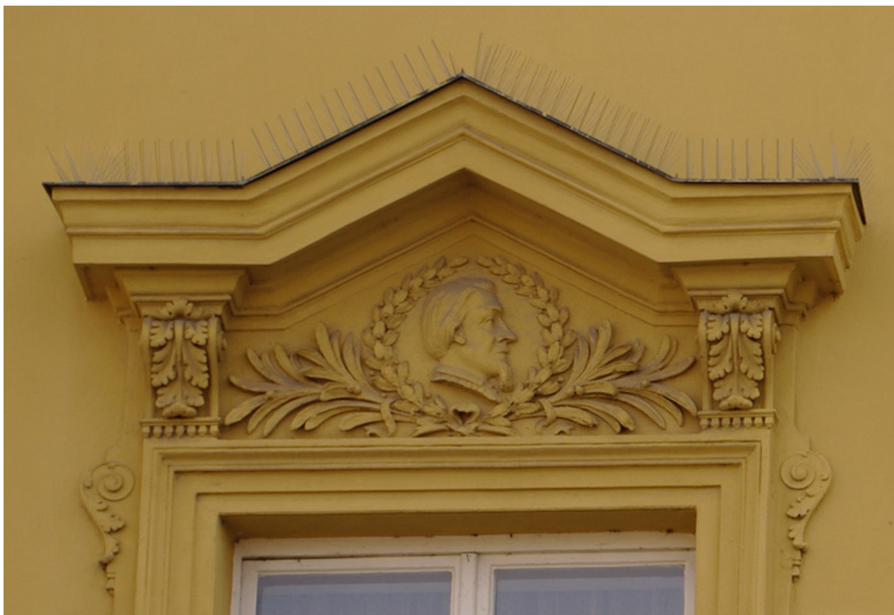
Obr. 54: Fronton prvního okna severního průčelí v úrovni 2.N.P. (počítáno od východu); v suprafenestře se nachází basreliéf snad Bohuslava Balbína (Kudrnovský, 2013).