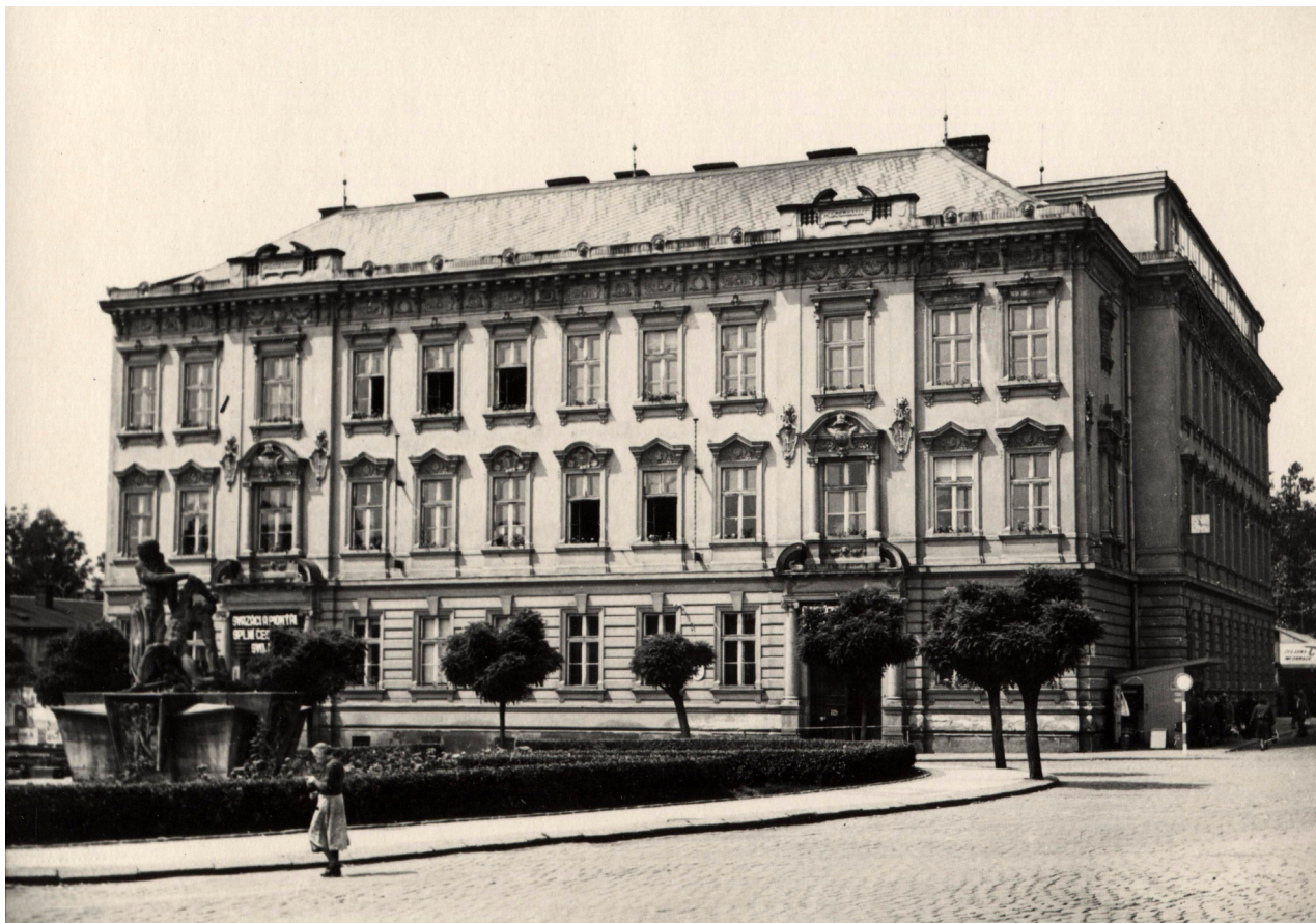
Obr. 12: Náměstí Odboje s budovou gymnázia, 50. léta - počátek 60. let (archiv Městského muzea v DKnL, Náměstí Odboje, F4/2021, Městské muzeum DKnL).