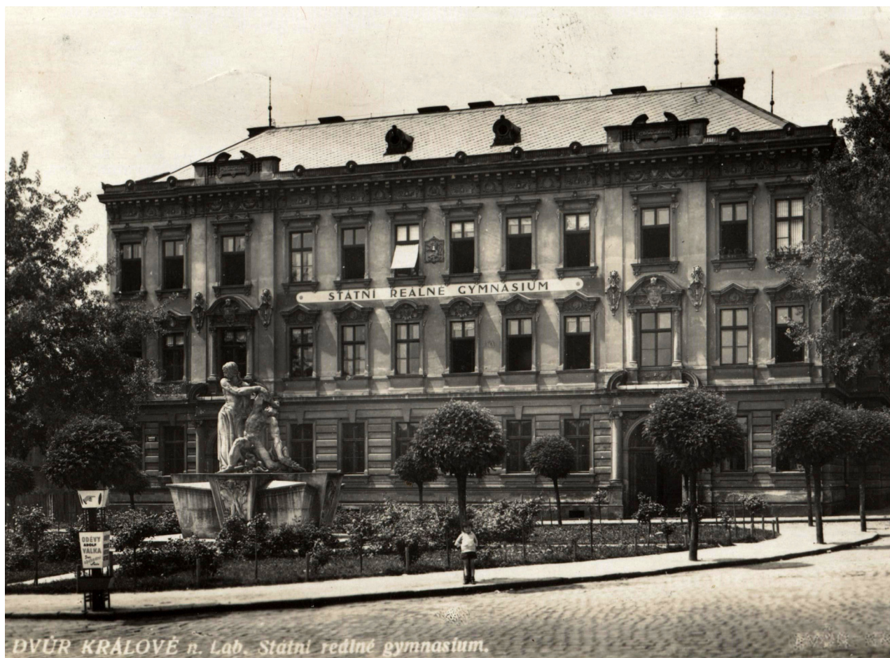
Obr. 6: Pohled na budovu gymnázia, po roce 1923, před rokem 1929 (archiv Městského muzea v DKnL, Geislerova sbírka, Náměstí Odboje, 174/99, Městské muzeum DKnL).