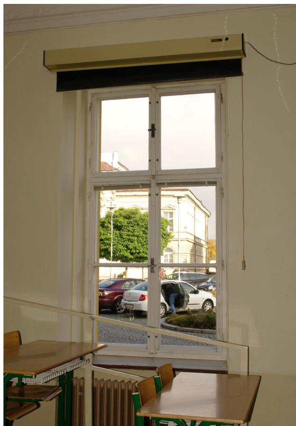
Obr. 42, 43: Okno východního a severního průčelí v úrovni 1.N.P.; vpravo pohled na jednu z novodobých okenních výplní nacházejících se v úrovních 1 - 3.N.P. (Kudrnovský, 2013).