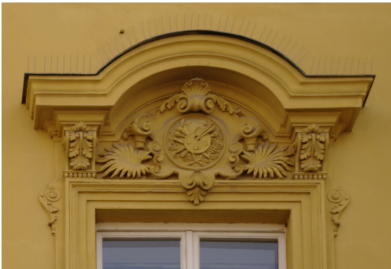
Obr. 60: Fronton sedmého okna severního průčelí v úrovni 2.N.P. (počítáno od východu); v suprafenstře se nachází basrelief s palety a štětců, jakožto symbolů malířství (Kudrnovský, 2013).