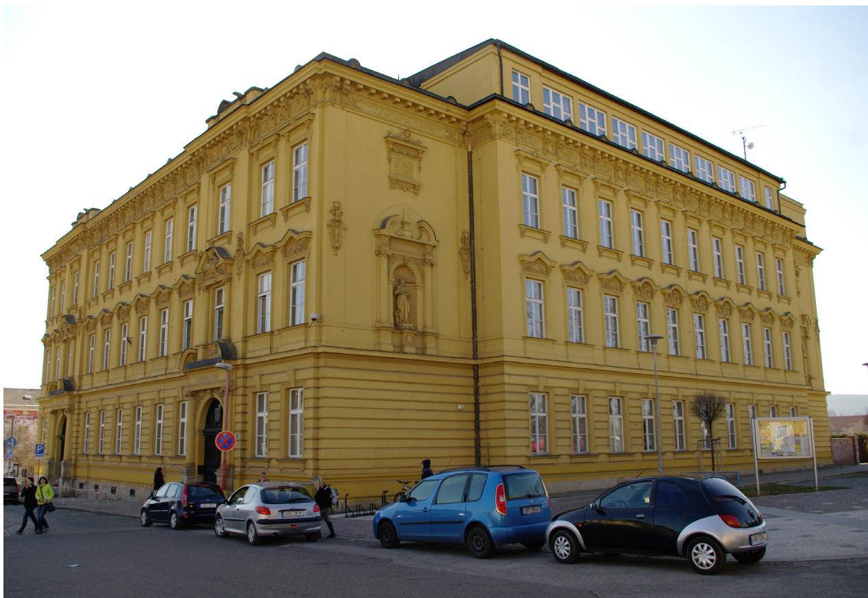
Obr. 46: Pohled na budovu gymnázia od severovýchodu (Kudrnovský, 2013).