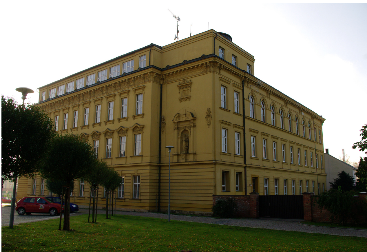
Obr. 65: Pohled na budovu gymnázia od severozápadu (Kudrnovský, 2013).