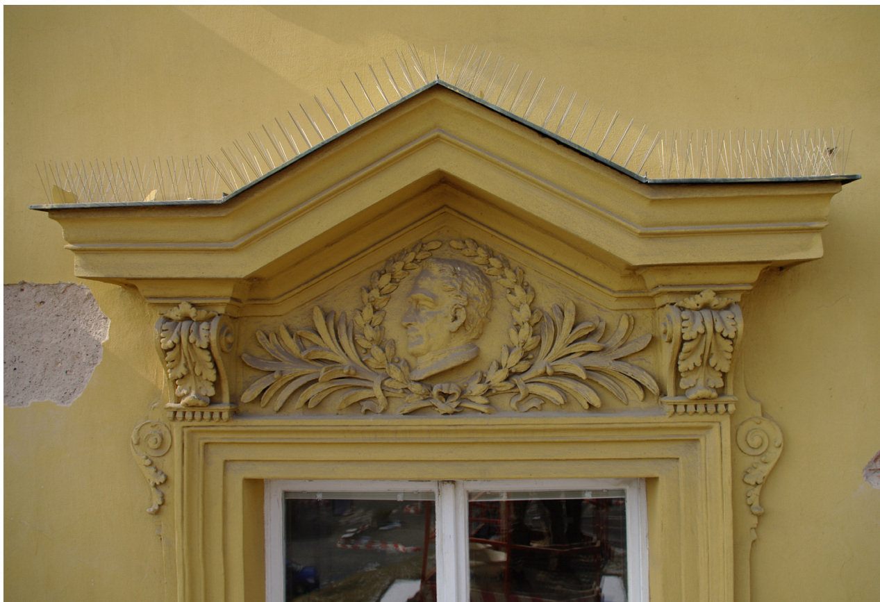
Obr. 33: Fronton osmého okna východního průčelí v úrovni 2.N.P. (počítáno od jihu); v suprafenstře se nachází nerozpoznaný basreliéf (Kudrnovský, 2013).