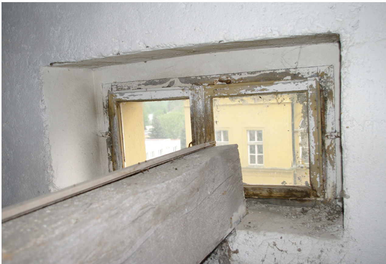
Obr. 67: Původní okenní výplň osvětlující půdní prostor (Kudrnovský, 2013).