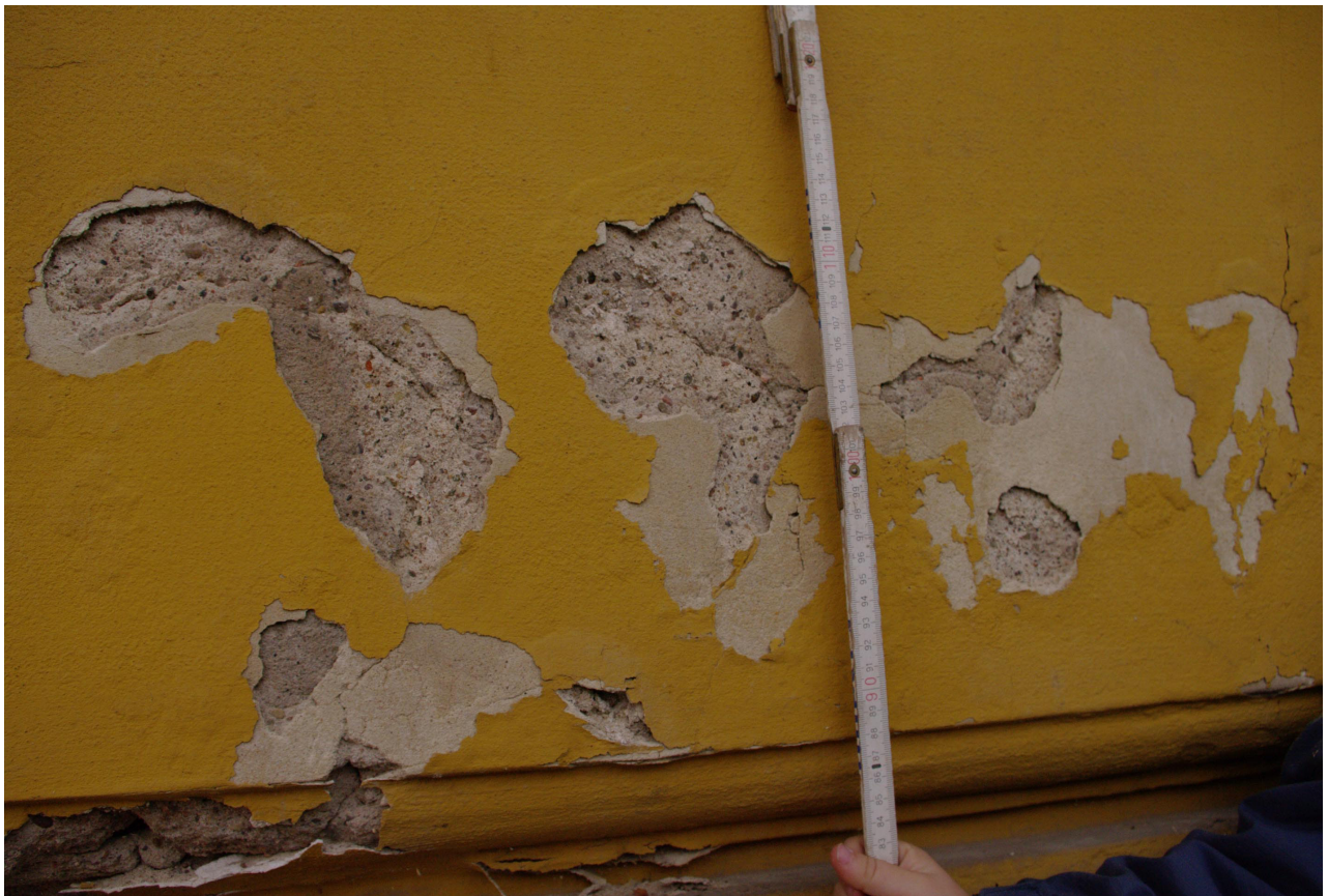
Obr. 76: Solemi a vlhkostí poškozená původní soklová omítka východního průčelí východního křídla budovy (Kudrnovský, 2013).