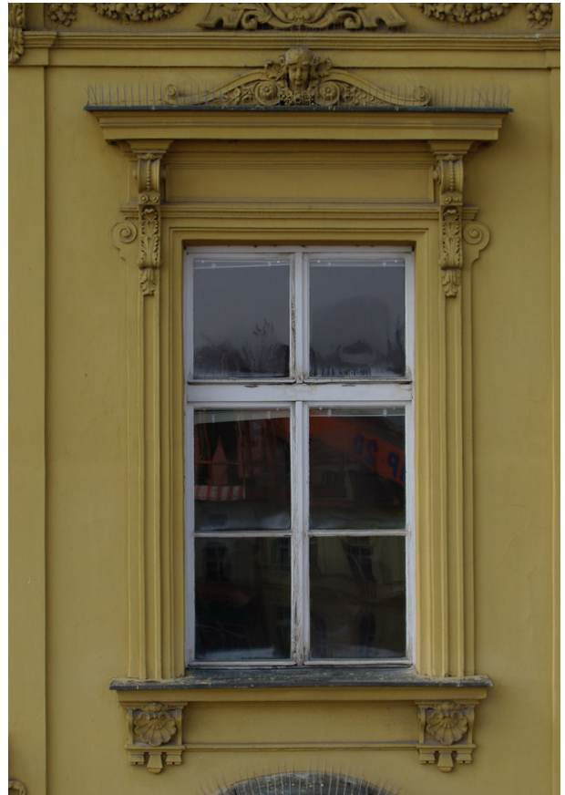
Obr. 38, 39: Okna východního a severního průčelí v úrovni 3.N.P.; vpravo okno situované v jednom z mělkých rizalitů (Kudrnovský, 2013).